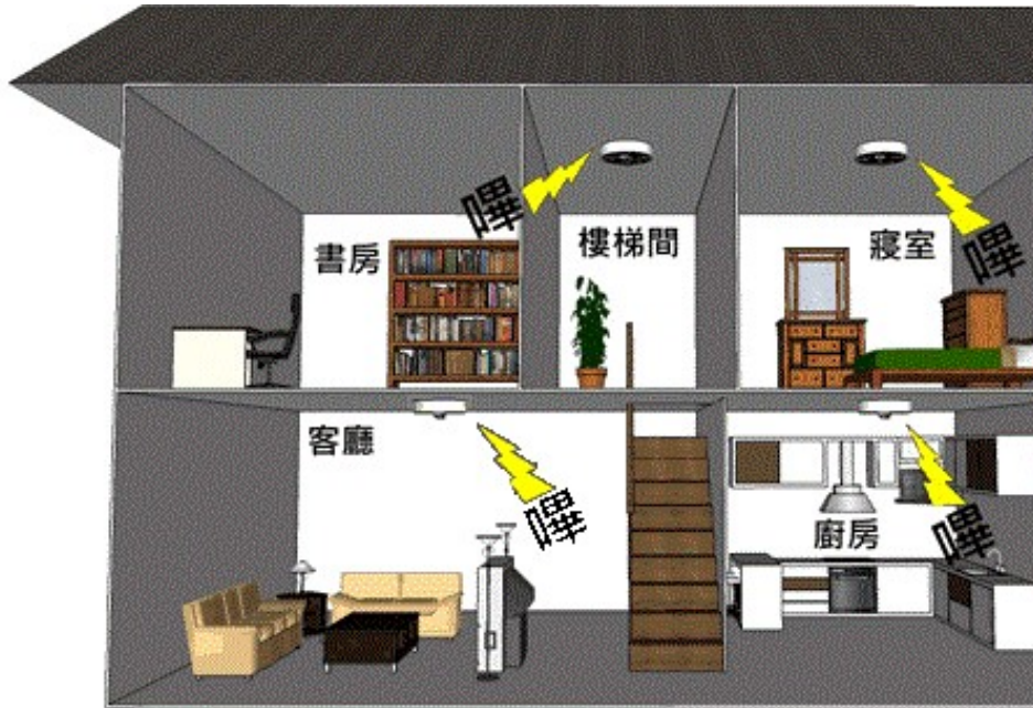
公寓住宅用火災警報器裝設示意圖