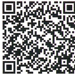
都市計畫書圖內容及簡報下載

（三）本府都市發展局網站： http://urban-web.kcg.gov.tw →「都市計畫專區」→「都市計畫公告」→「公告公開展覽」→點選本計畫案名。