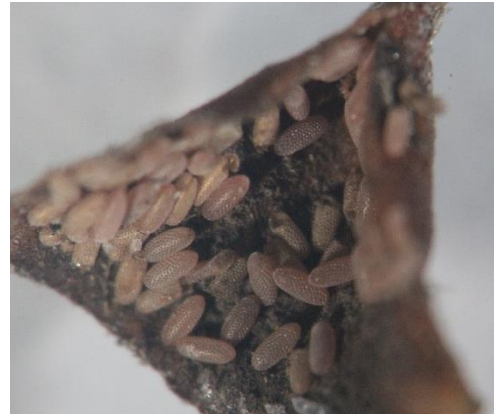
圖 2、喜產卵於套袋內