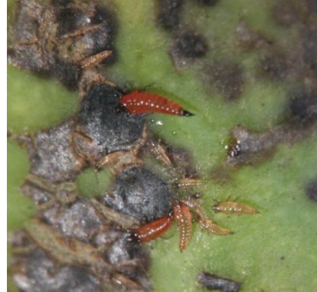
圖 8、幼蟲偏好生活於傷口腐爛處