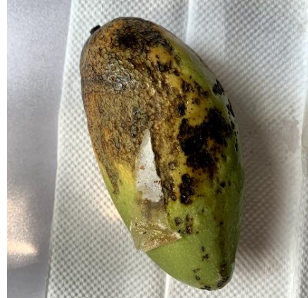
圖 10、套袋後本種蓟馬危害造成果實腐壞