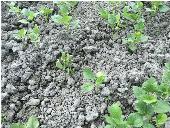
紅豆田區根腐病發病造成植株萎凋-2