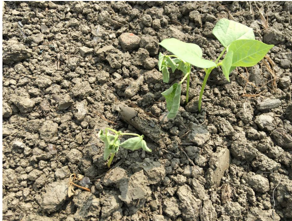
紅豆田區根腐病發病造成植株萎凋-1