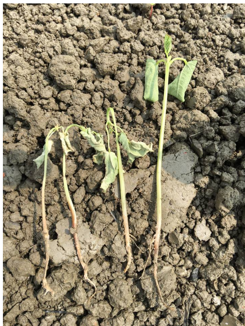
感染根腐病的紅豆苗株