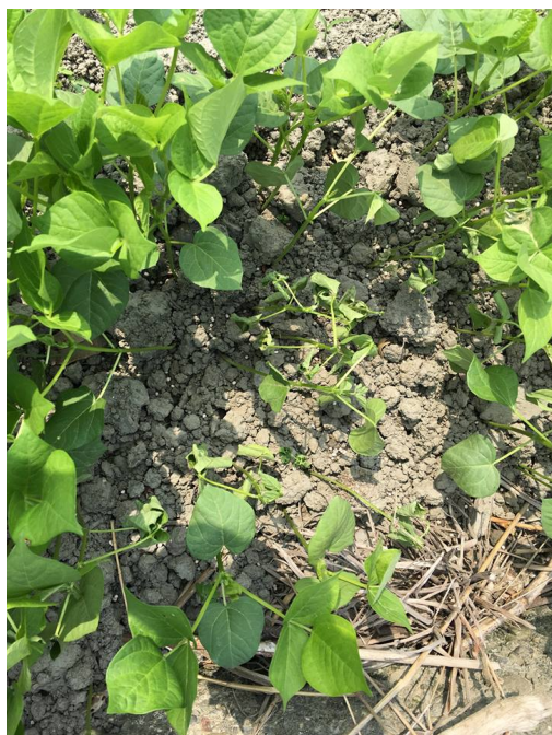
紅豆田區根腐病發病造成缺株