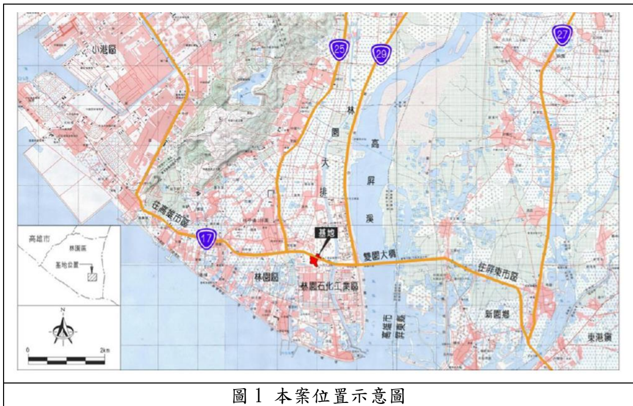
圖 1 本案位置示意圖

本案位屬本市大坪頂以東地區都市計畫，為林園區五福里 13-17 鄰部分土地（如圖 1）。基地南側、東側鄰接林園工業區，北側、西側鄰現有住宅區、農業區。