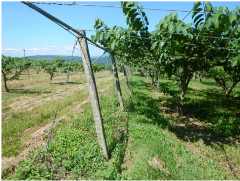
圖3. 四週水泥柱以粗3分(含)以上之鋼索串連固定，棚架內以2分(含)以上鋼索圍成格狀