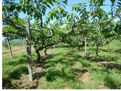
圖2. 內支柱間隔立柱