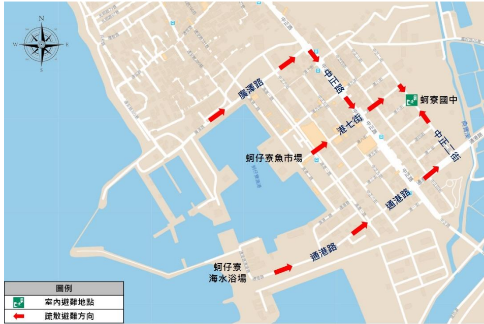
圖 2 蚵子寮漁港避難路線圖