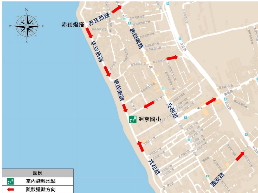
圖 1 赤崁燈塔至通安路避難路線圖