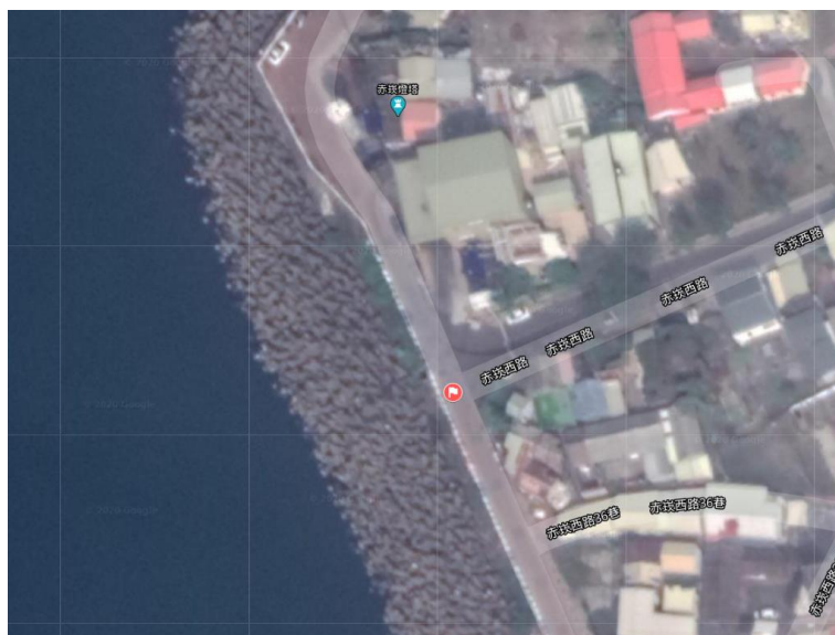
圖 6 梓官區赤崁燈塔空照圖

座標為 N 22.73731°、E 120.24573°，周圍空曠且前方無遮蔽物，指示牌可醒目設置、不影響民眾動線，故納入選址地點，赤崁燈塔之空照圖如圖 6 及實景圖如圖 7 所示。