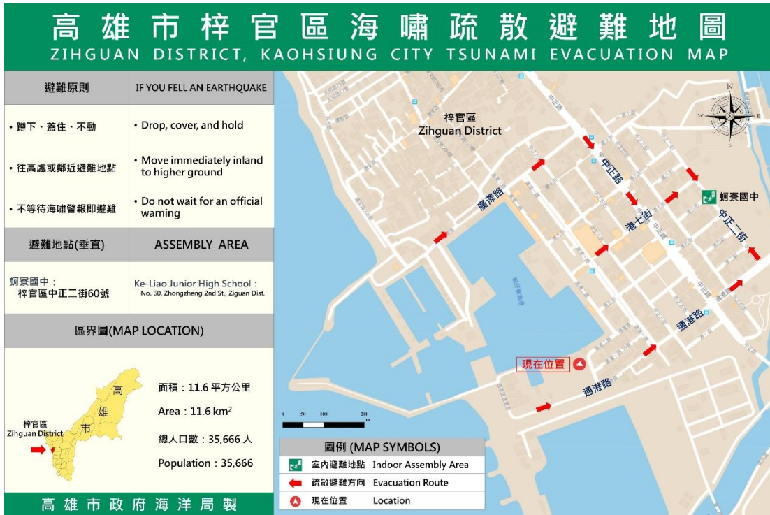
圖 5 位於梓官區蚵子寮漁港停車場之海嘯疏散避難地圖