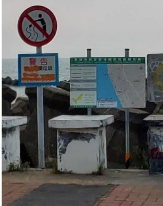
圖 7 梓官區赤崁燈塔告示牌設置實景圖