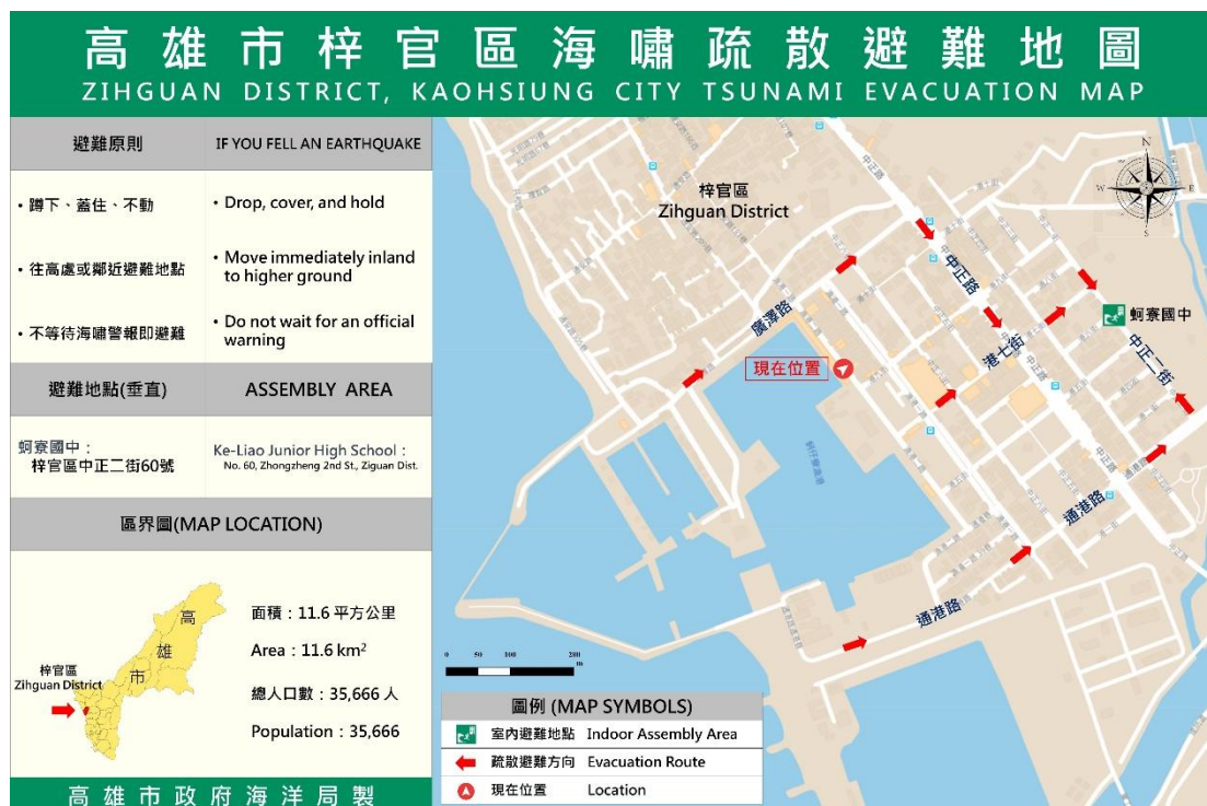
圖 4 位於梓官區蚵子寮漁港之海嘯疏散避難地圖