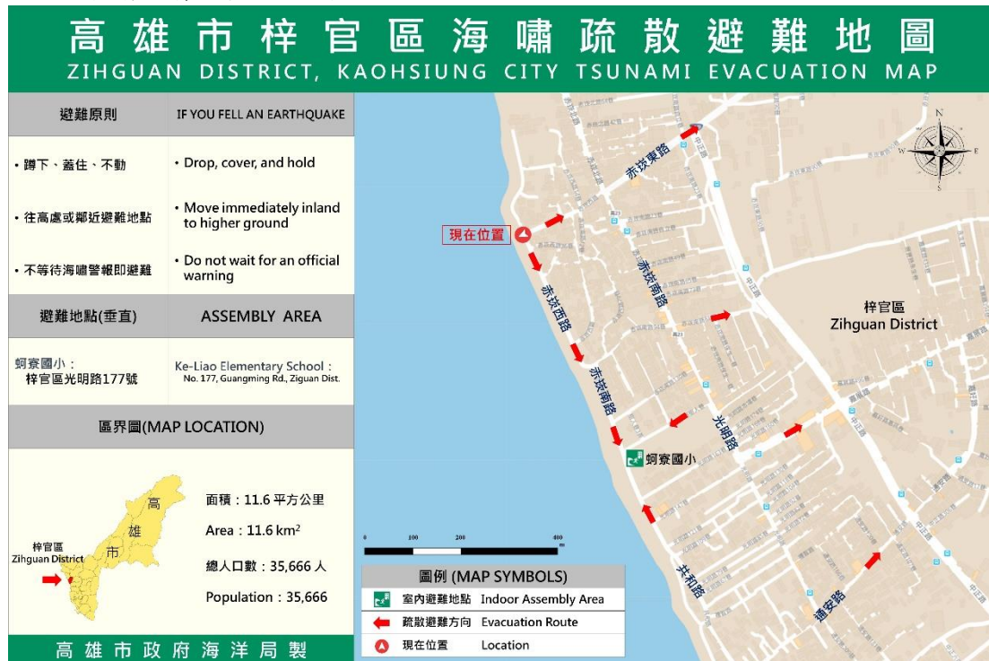
圖 3 位於梓官區赤崁燈塔之海嘯疏散避難地圖