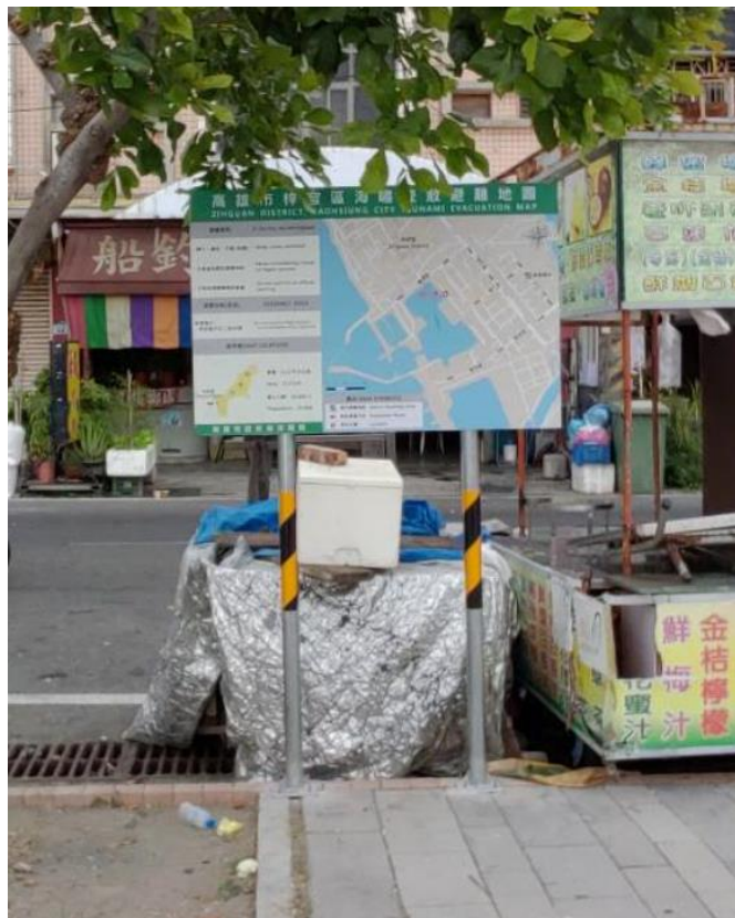
圖 9 梓官區蚵子寮漁港觀光魚市告示牌設置實景圖