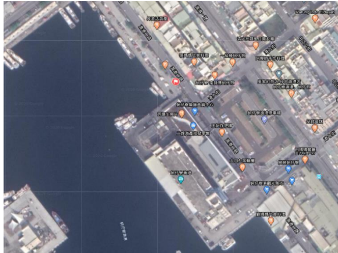
圖 8 梓官區蚵子寮漁港觀光魚市空照圖