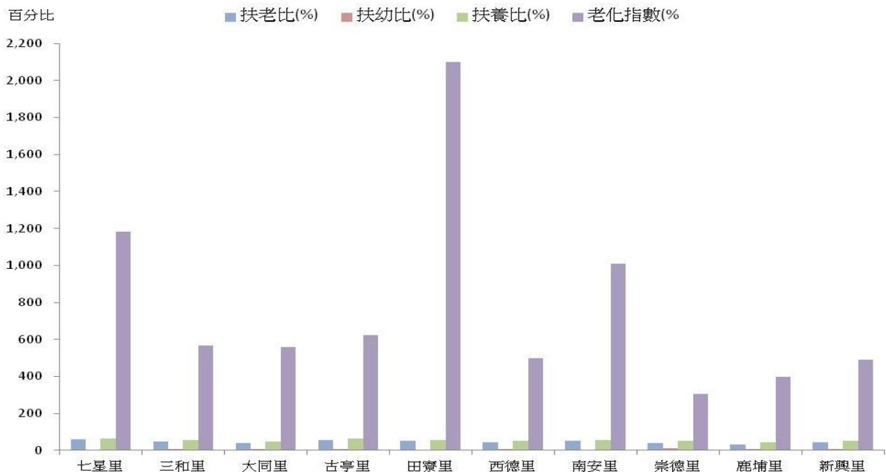
圖 2 高雄市田寮區各里人口年齡結構比較