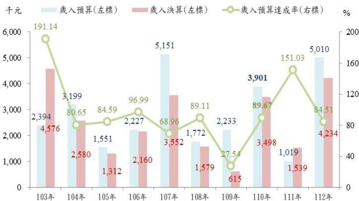
表 1 112 年高雄市田寮區公所 歲入預決算概況—按來源別分