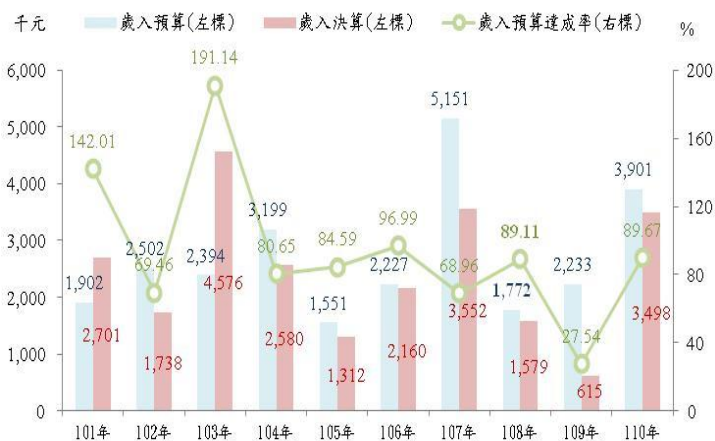
表 1 110 年高雄市田寮區公所 歲入預決算概況—按來源別分