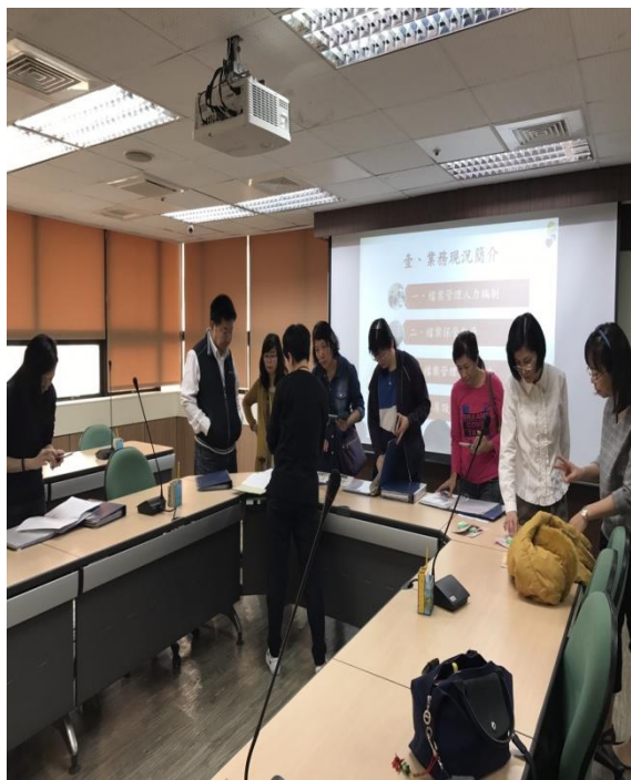
社會局管小姐解說檔案辦理情形