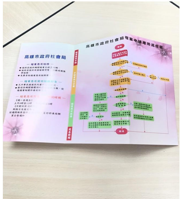
製作文宣提昇檔案應用加值服務