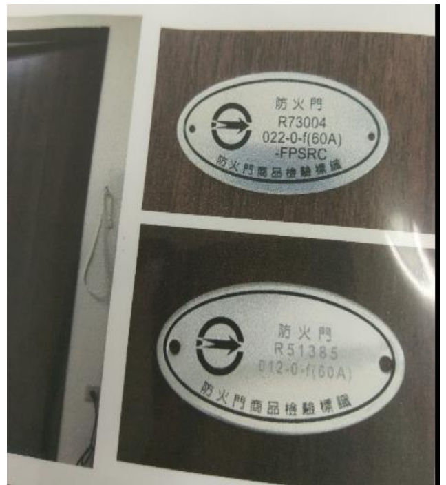
防火門及防火證明