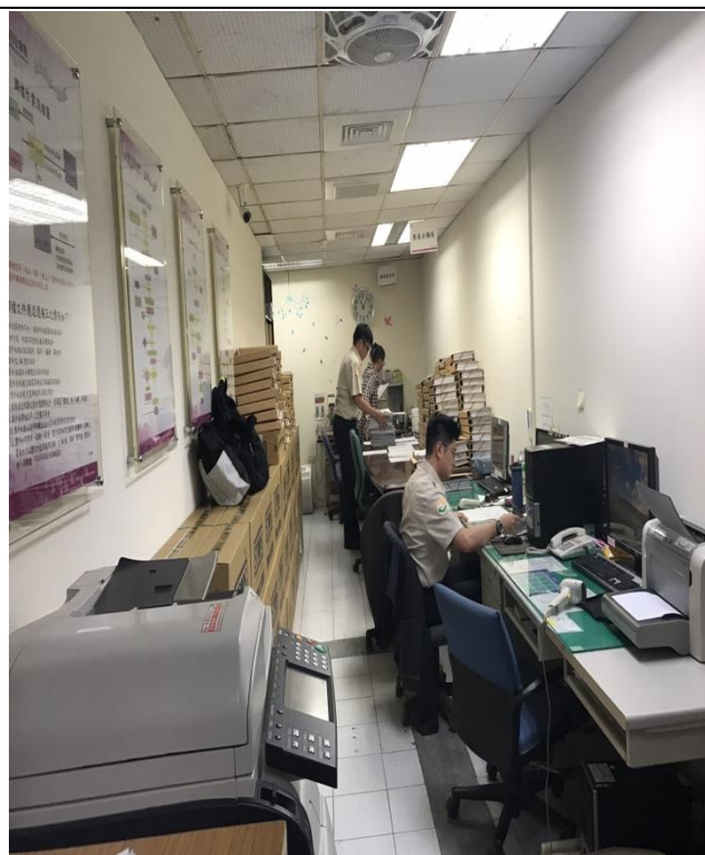
替代役協助整理檔案