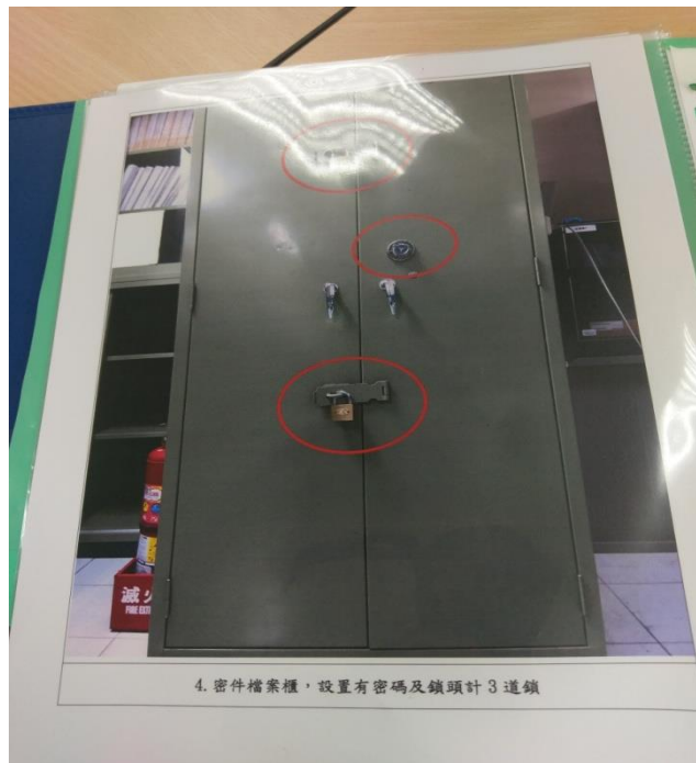
密件檔案櫃設置有密碼及鎖頭計3道鎖