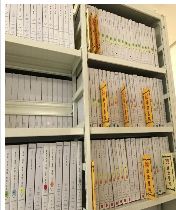
資料有系統擺放及歸類，一目了然