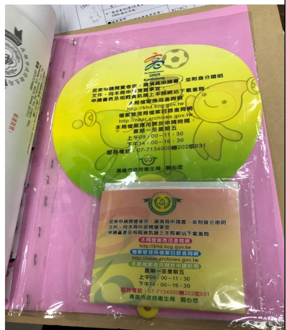
製作文宣提昇檔案應用加值服務