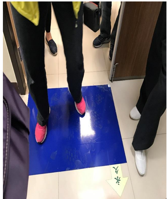
設置可更換之防髒地墊，預防汙染