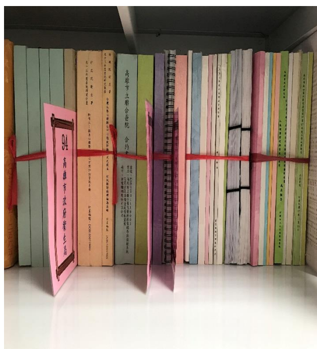
設置公文附件專區並加以分類