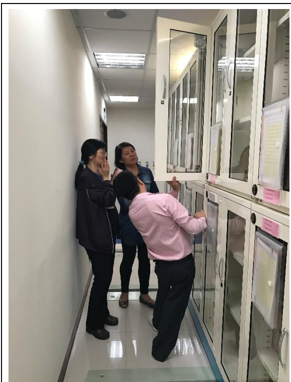
設有大型防潮櫃裝置公文附件