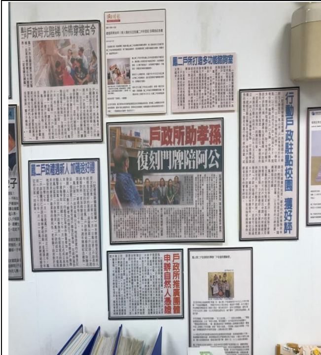
善加利用報章媒體廣為宣導