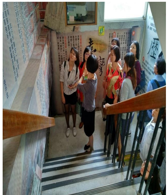
利用畸零空間規劃檔案時光階梯