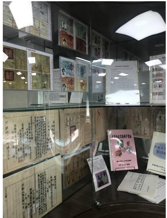
設置歷史檔案文物展示櫃