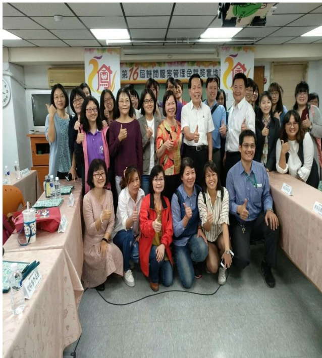
結合各區公所辦理聯合參訪交流