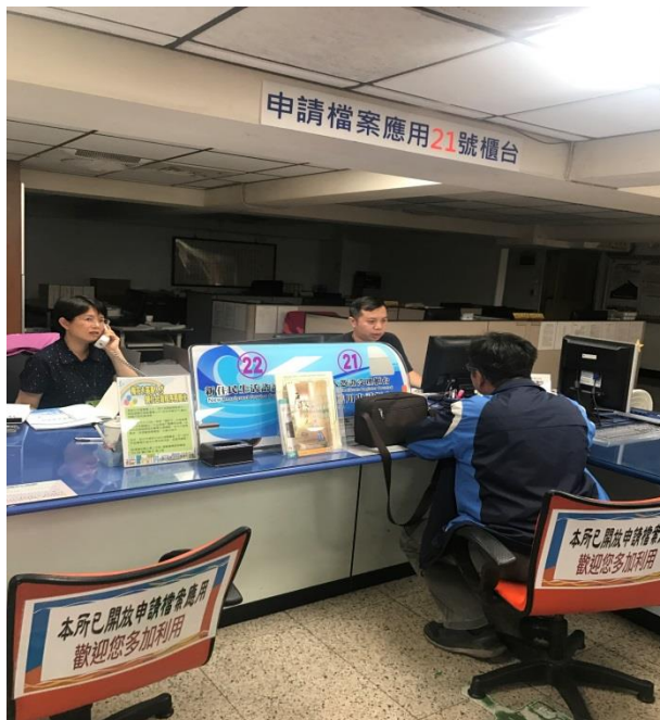
檔案應用服務專用櫃台