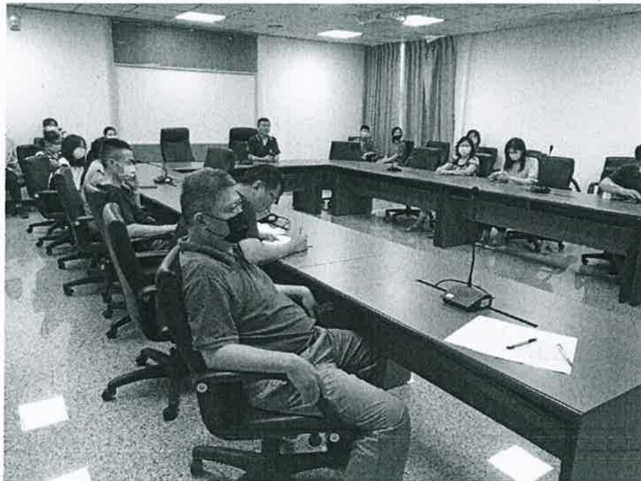
說明：召開檢討會議