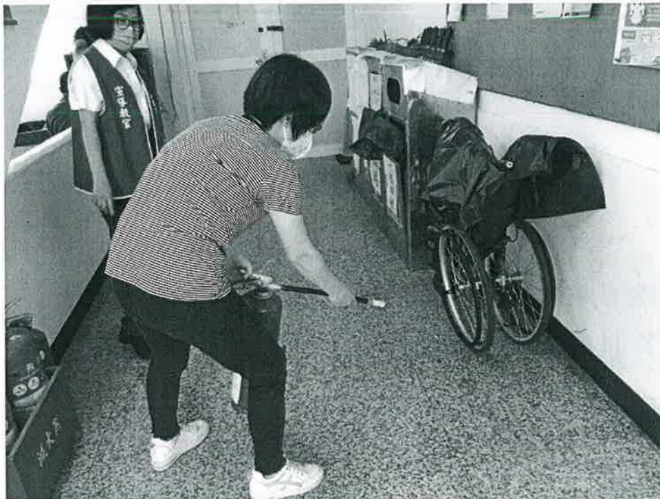
說明：初期滅火（滅火器）情形