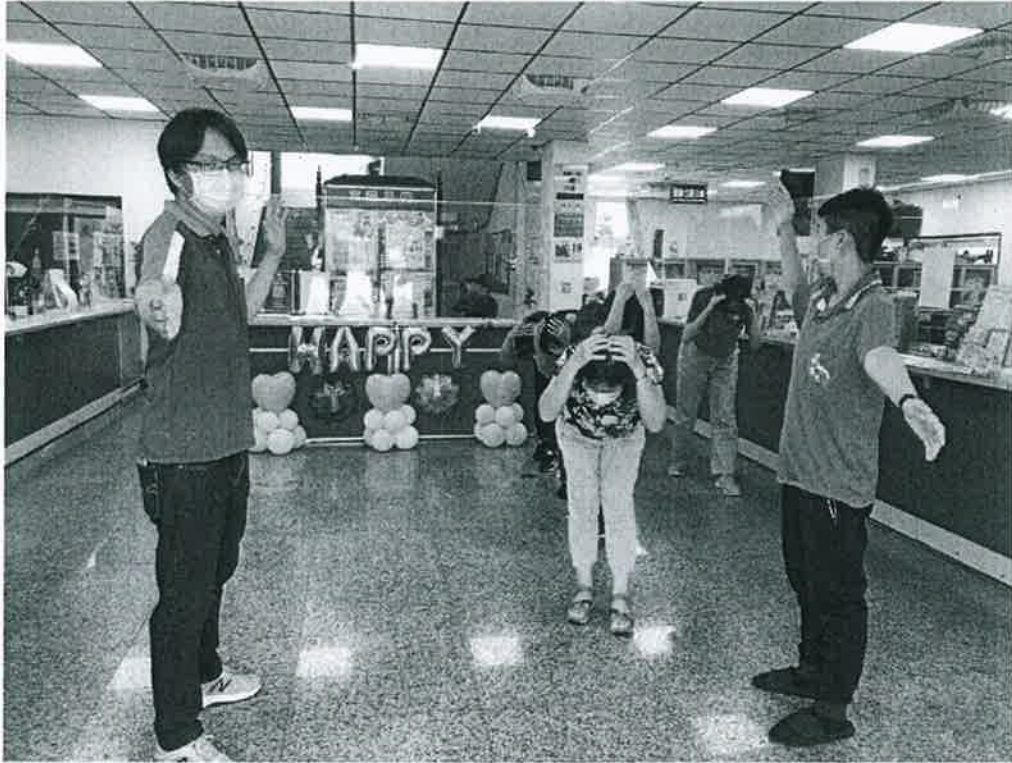
說明：引導避難逃生情形