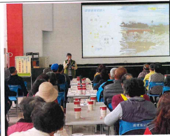
防救災工作不分你我他，大家一起來