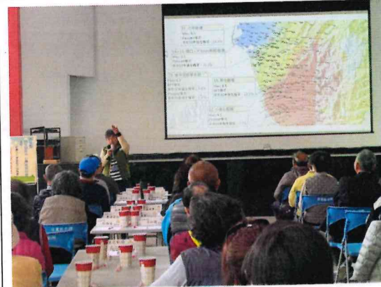
說明茄萣區附近周圍的斷層地帶