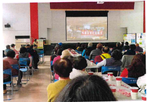
與本區長老教會合辦防災經驗分享