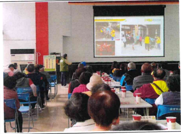
鄰區協作中心經驗分享