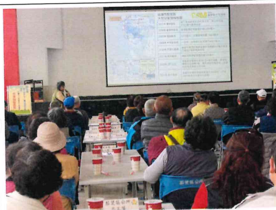
以茄萣區天然災害潛勢地圖說明各項災害雨量