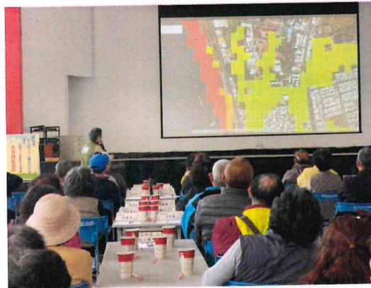
說明茄萣區附近周圍的海嘯可能情形