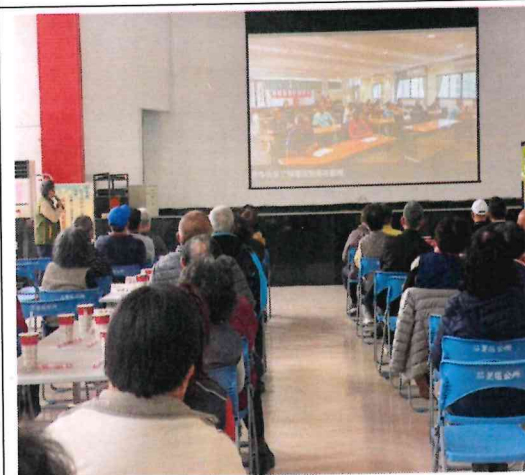
與本區長老教會合辦防災經驗分享