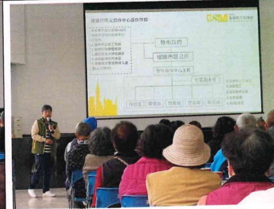
說明防災協作中心的成立與編組方式