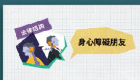
身心障礙者法律扶助專案