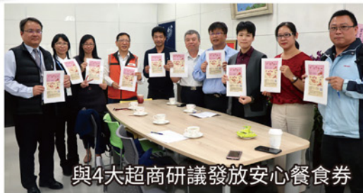
與4大超商研議發放安心餐食券