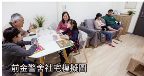
前金警舍社宅模擬圖