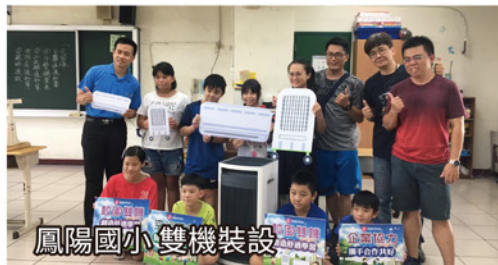
鳳陽國小 雙機裝設