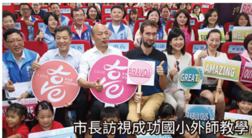
市長訪視成功國小外師教學