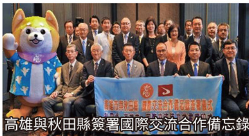
高雄與秋田縣簽署國際交流合作備忘錄