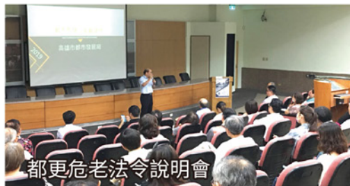
都更危老法令說明會