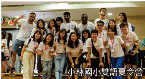
小林國小雙語夏令營