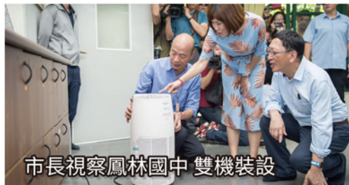
市長視察鳳林國中 雙機裝設