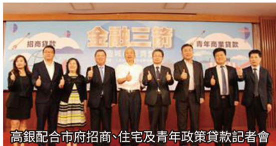
高銀配合市府招商、住宅及青年政策貸款記者會

為打造企業繁榮、人民安居、青年追夢的美好家園，我們攜手高雄銀行推出三大專案貸款，創造人民、企業與政府三贏局面，再造城市經濟繁榮。