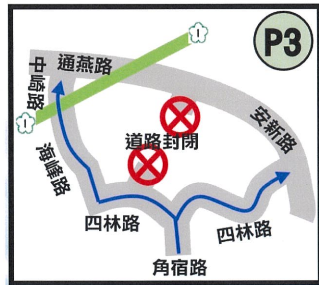
圖 3 路線指示牌(尺寸皆為 90*90CM)