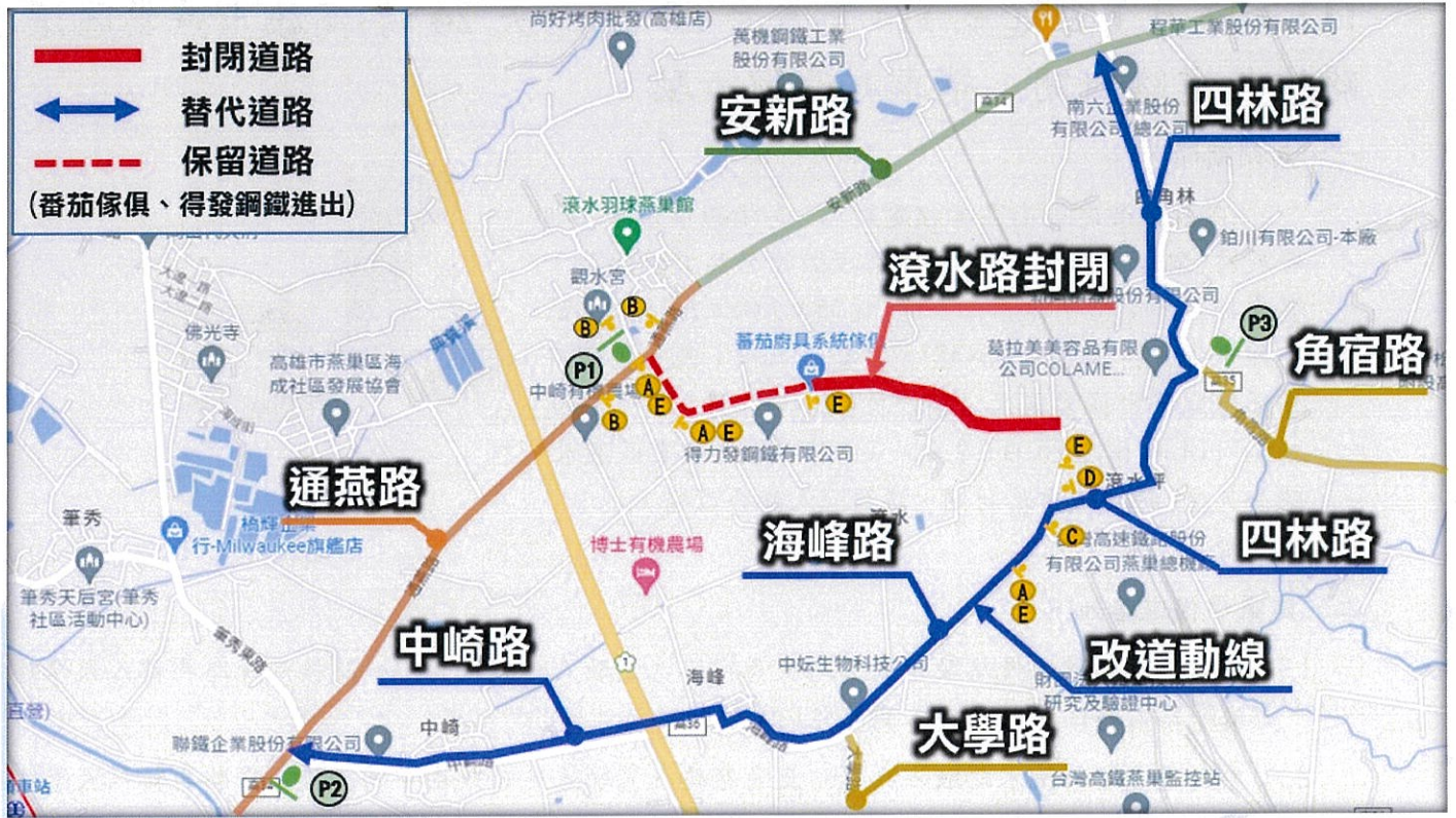
圖 1 道路封閉改道動線示意圖