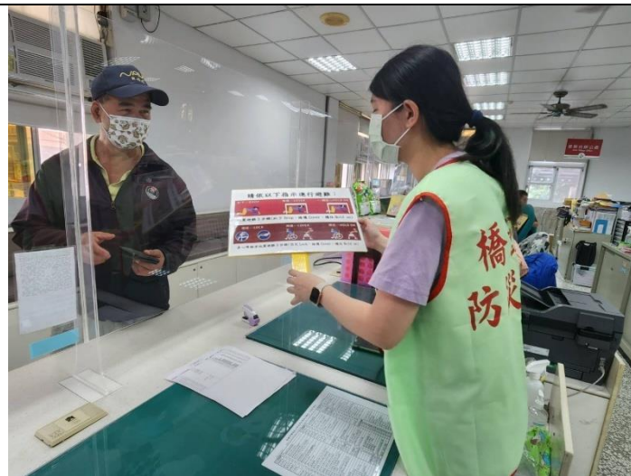
向民眾宣導避難知識