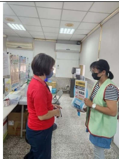
向民眾宣導避難知識