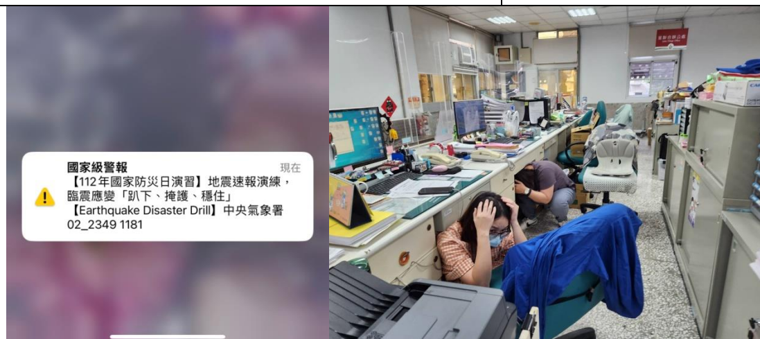
配合國家警報避震演練