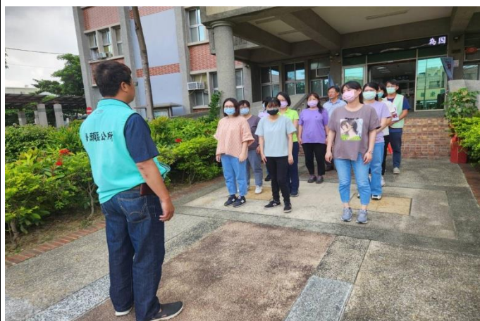
疏散演練-清點人數