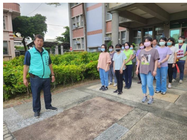
疏散演練-清點人數