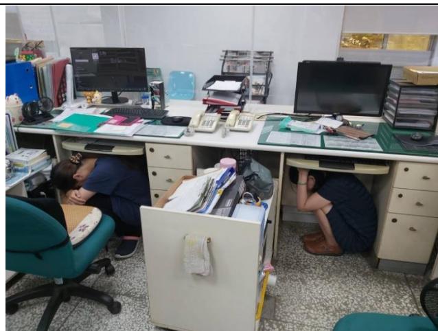
配合國家警報避震演練