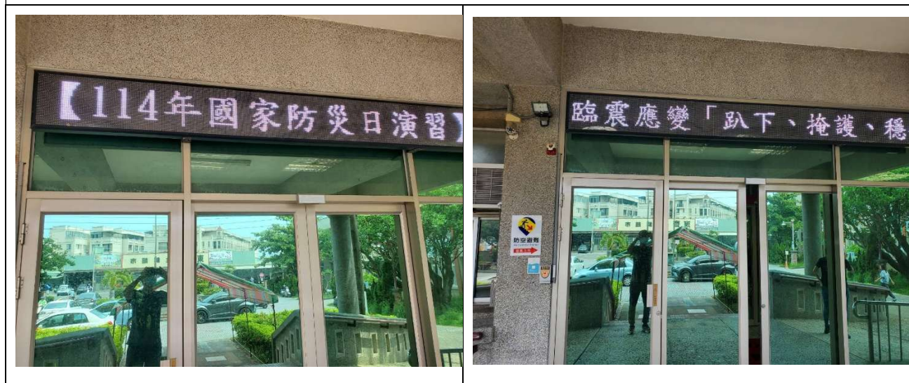
多媒體宣導辦理情形