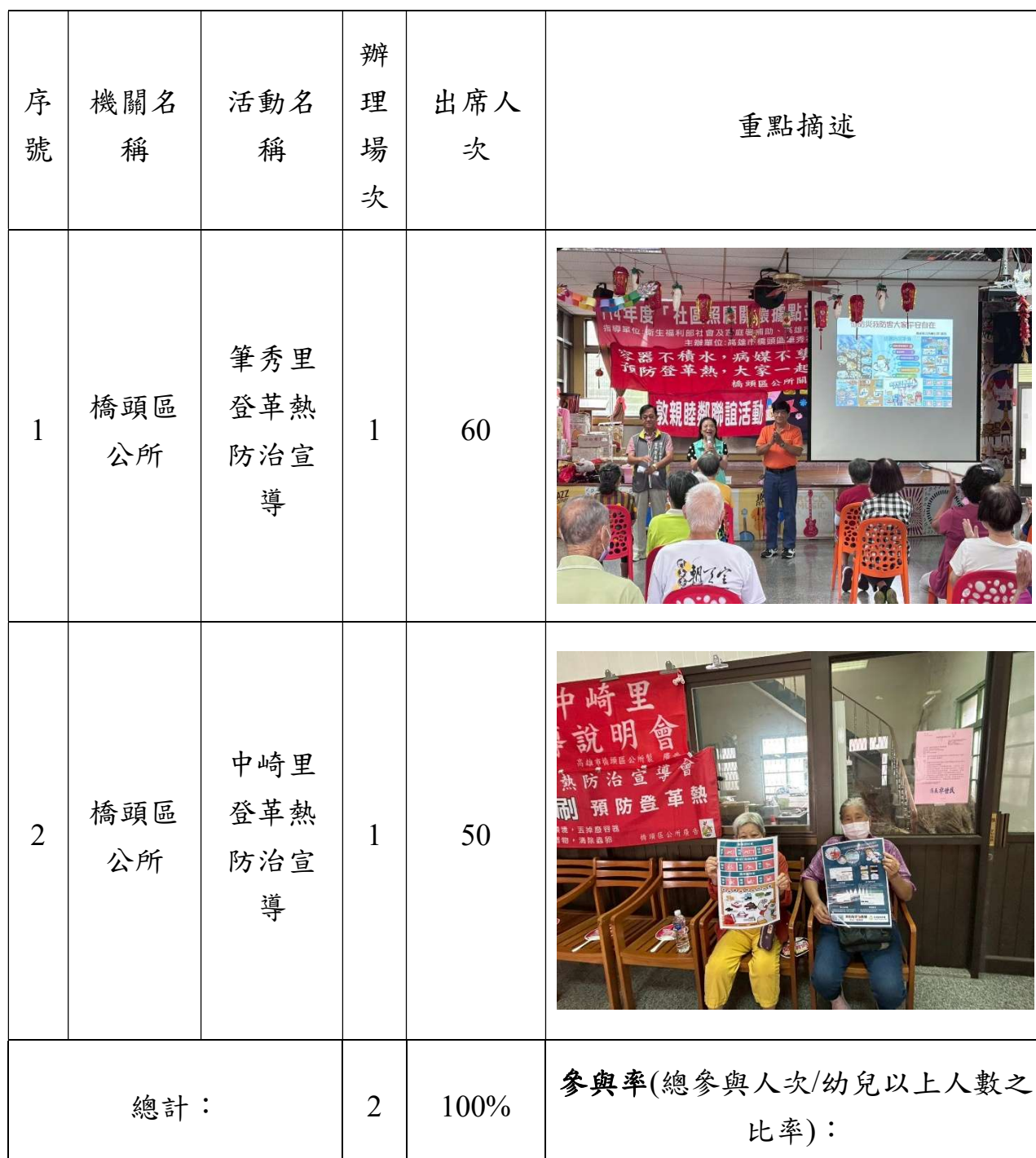
114 年國家防災日媒體露出成果表