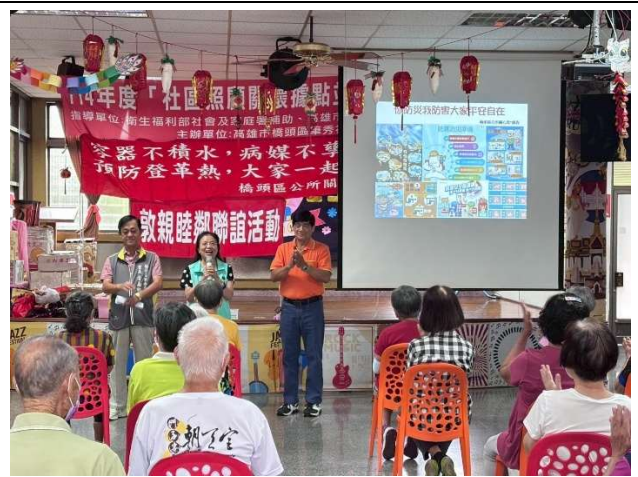
會議、活動向同仁、洽公民眾宣導辦理情形