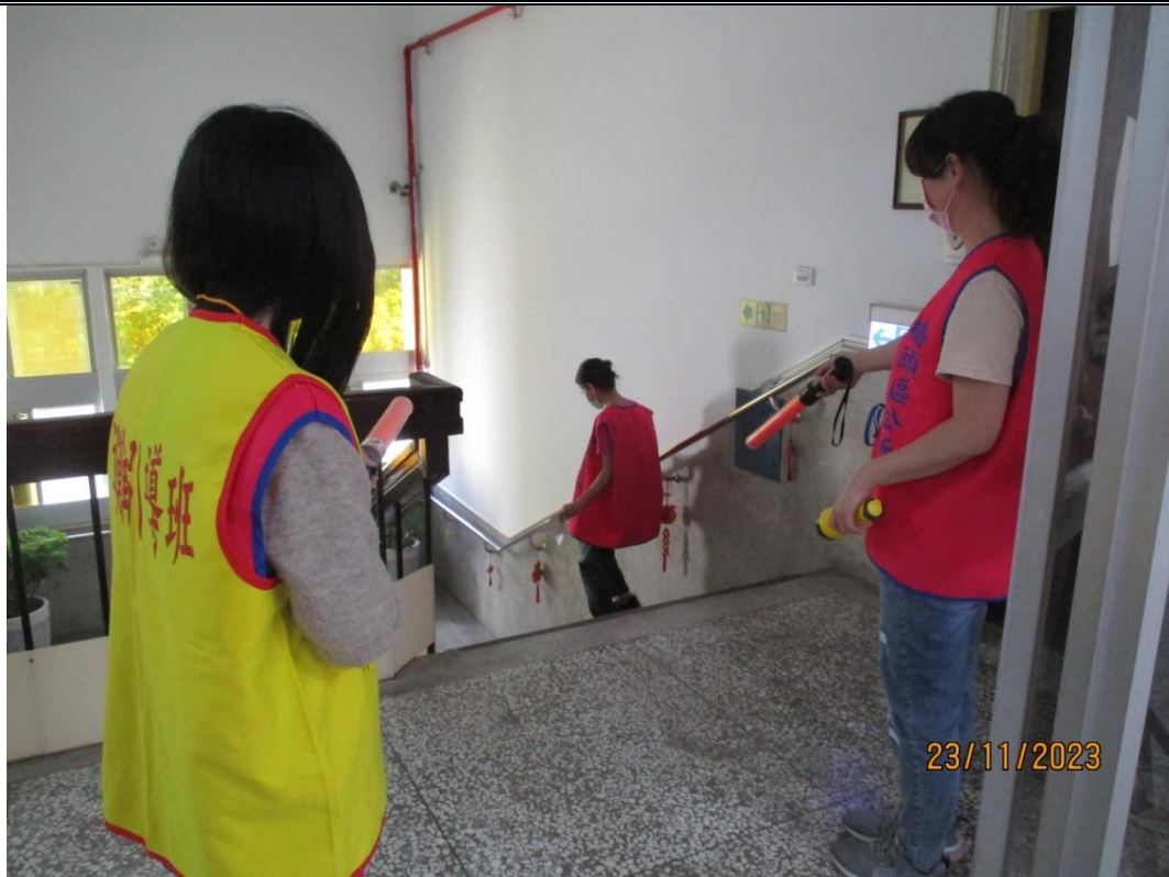
說明：引導避難逃生情形