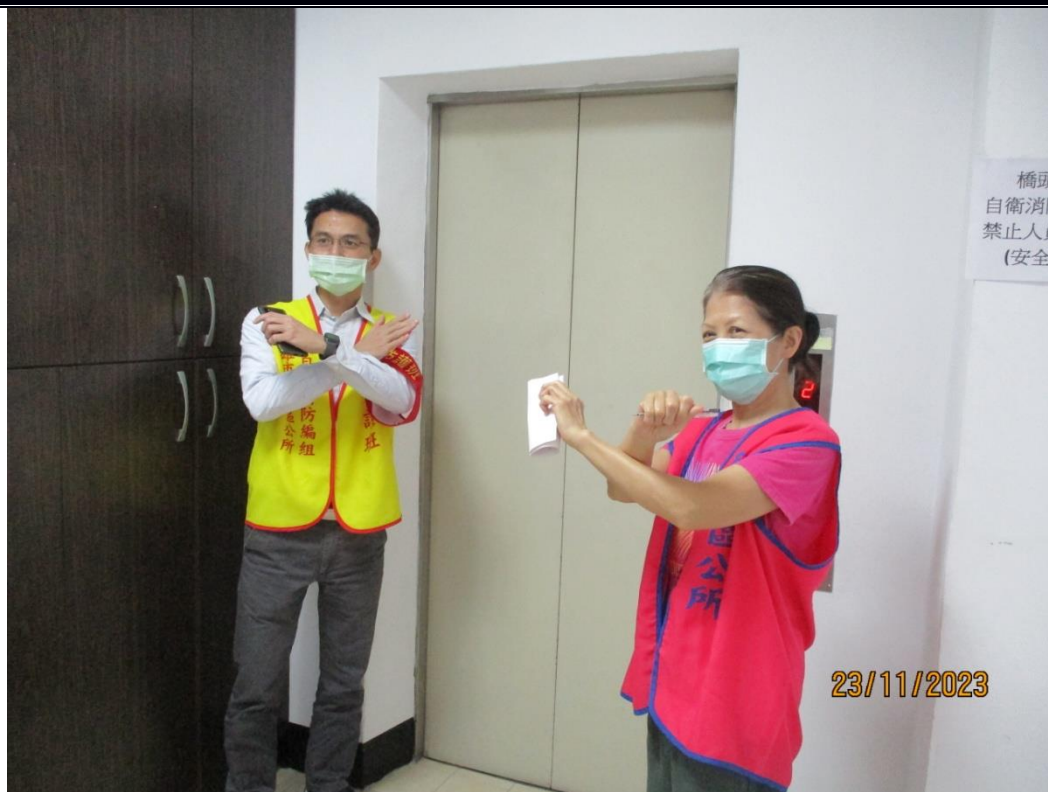
說明：安全防護(50人以上現場有管制電梯)