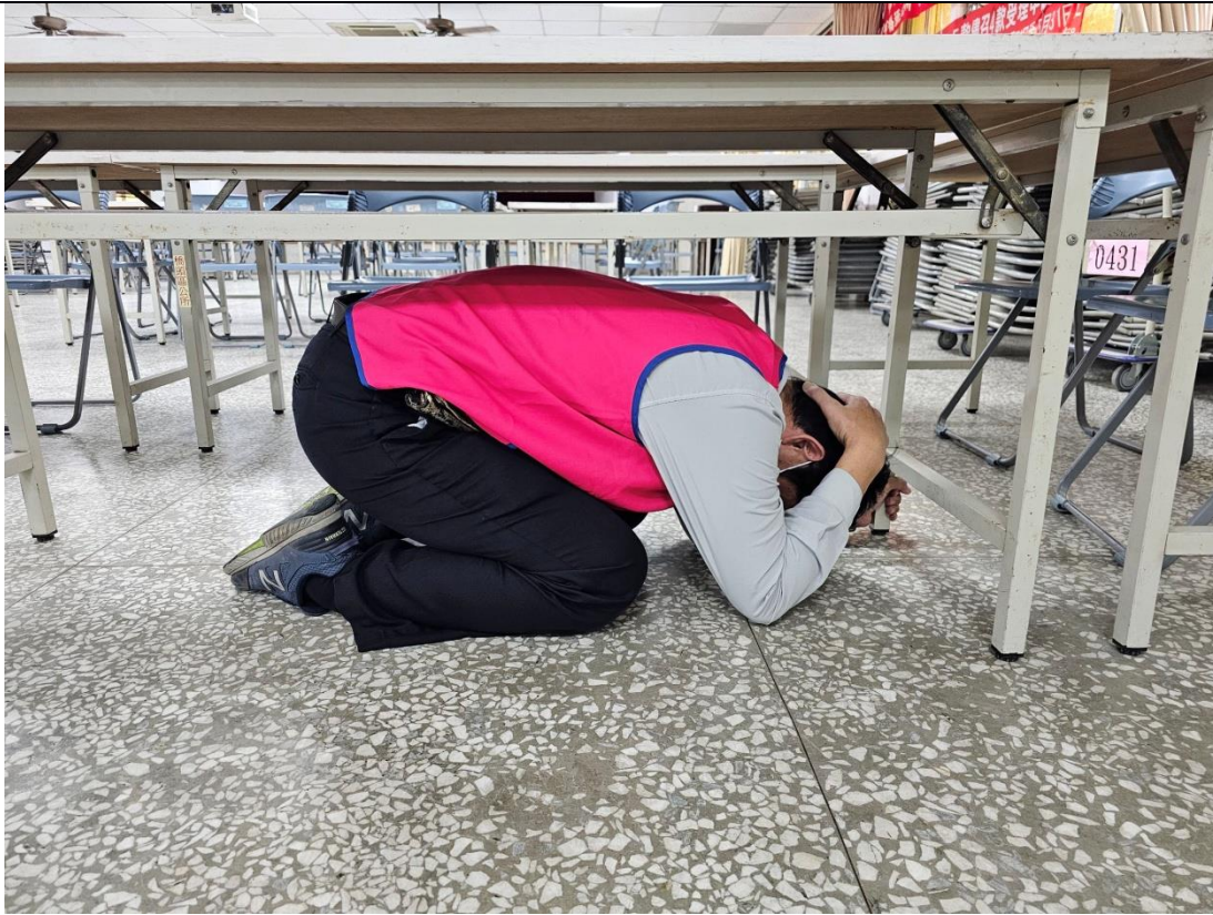
說明：防災防震教育情形