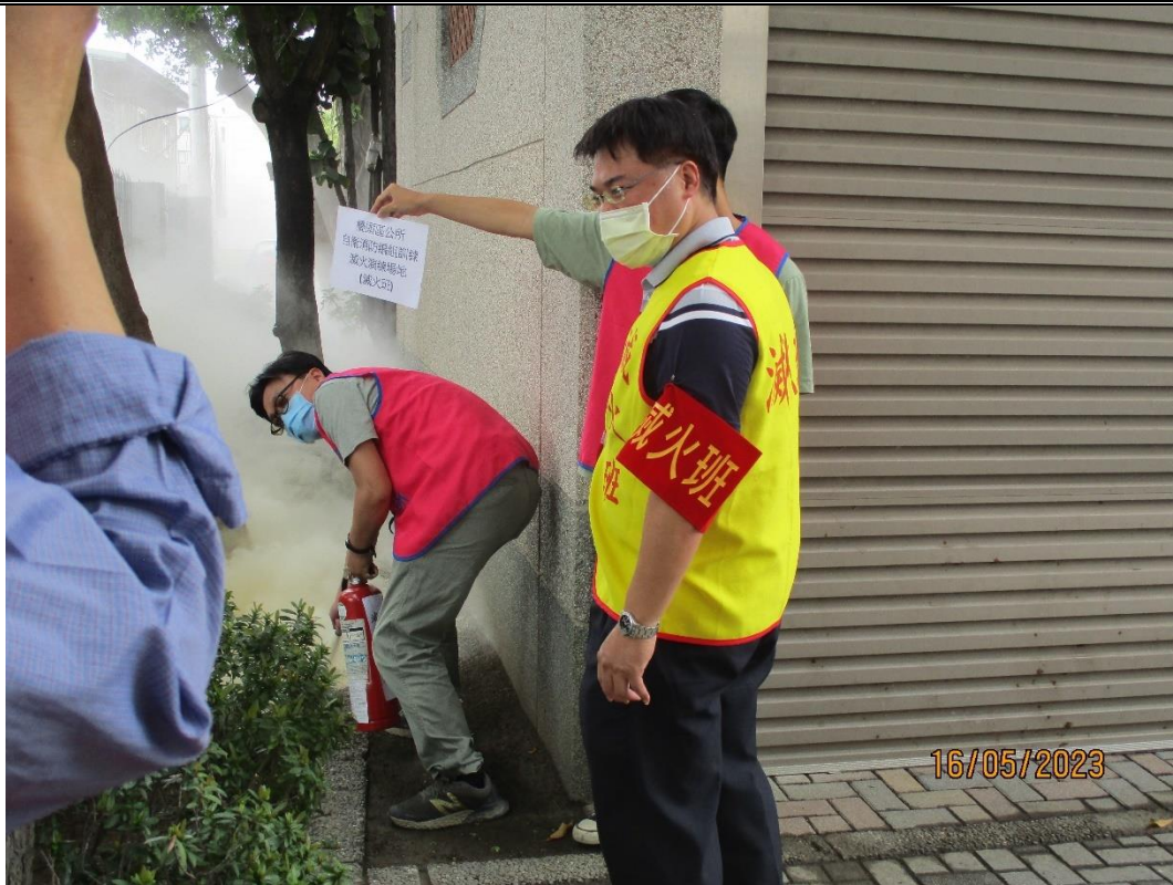
說明：初期滅火，使用滅火器情形