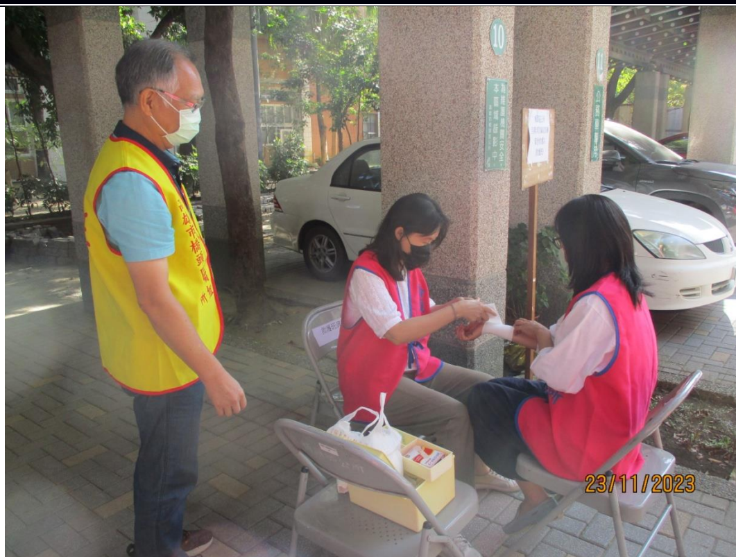
說明：救護急救處置情形