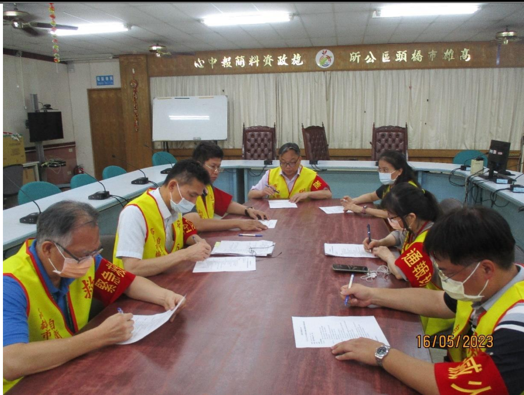
說明：召開檢討會議