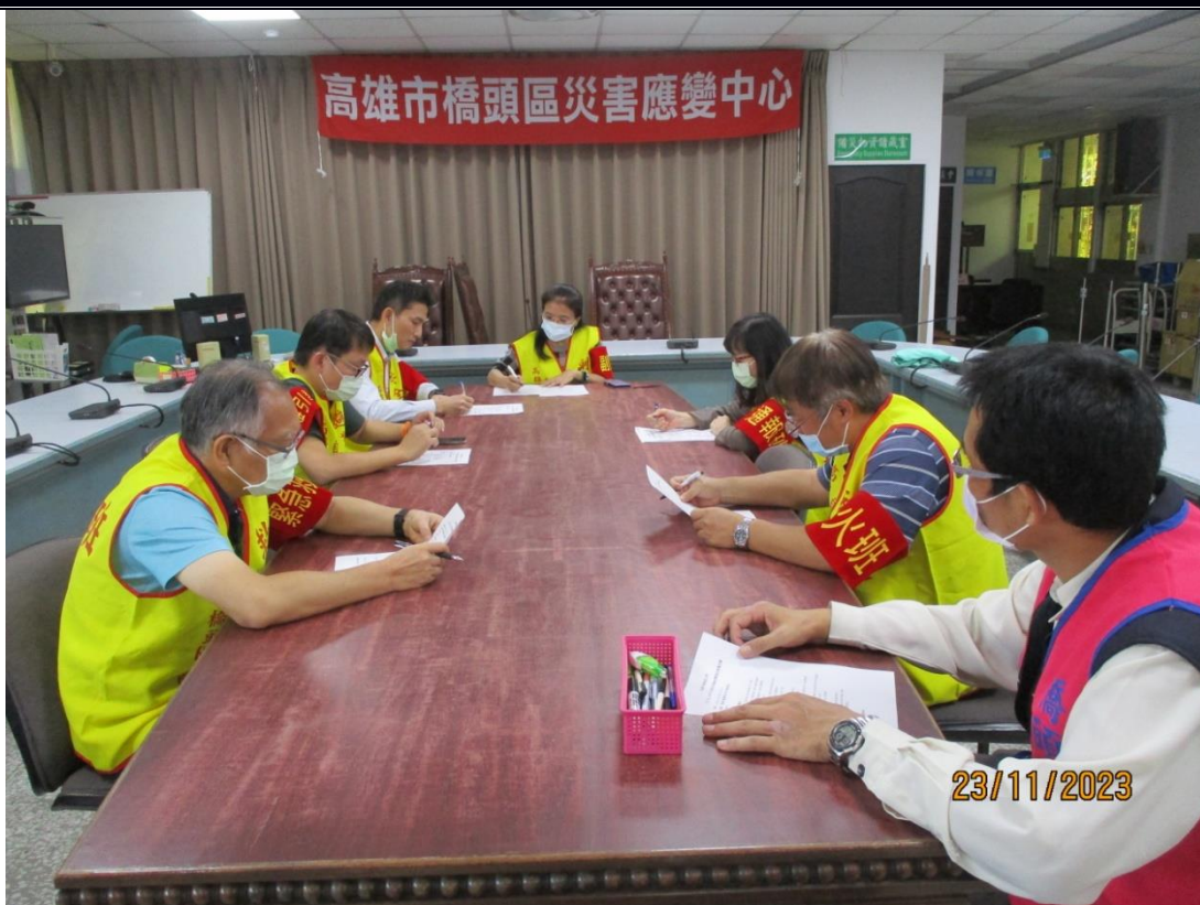
說明：召開檢討會議