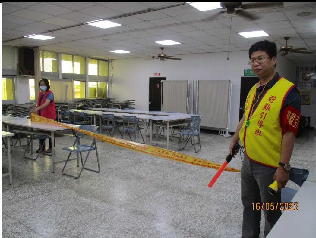
說明：引導避難逃生劃定警戒區