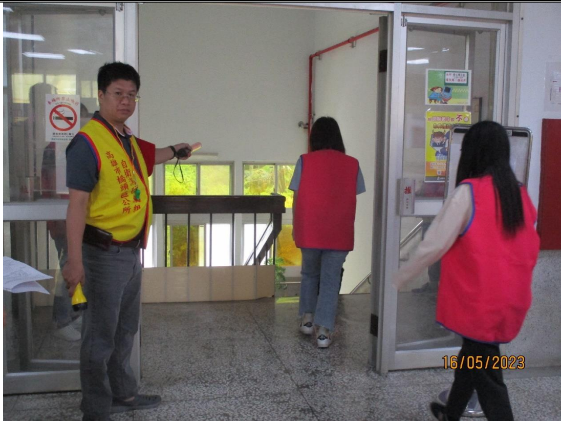
說明：引導避難由樓梯逃生情形