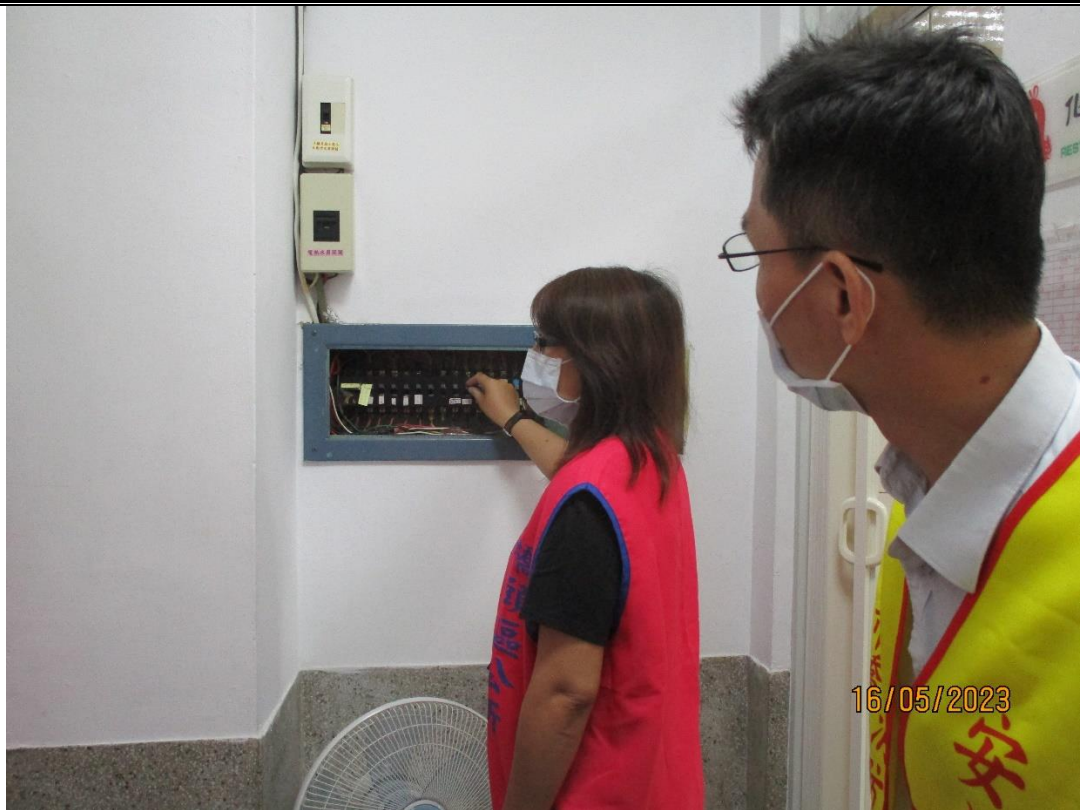
說明：安全防護，現場有電源，由本班人員關閉電源並確認