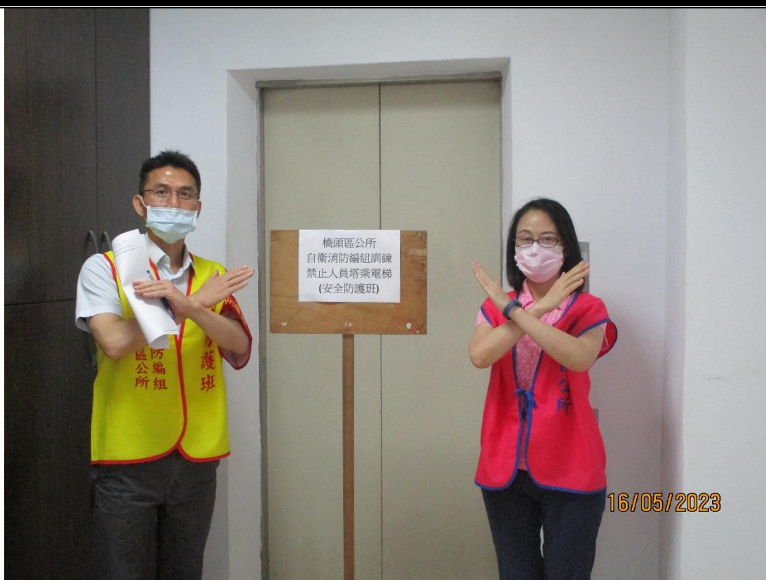
說明：安全防護，現場有電梯，由本班人員管制禁止人員搭乘電梯