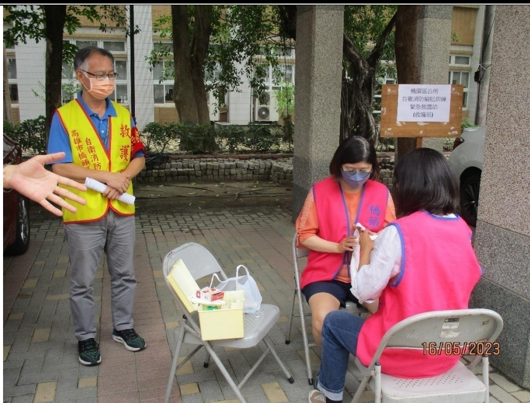
說明：救護急救處置情形 1