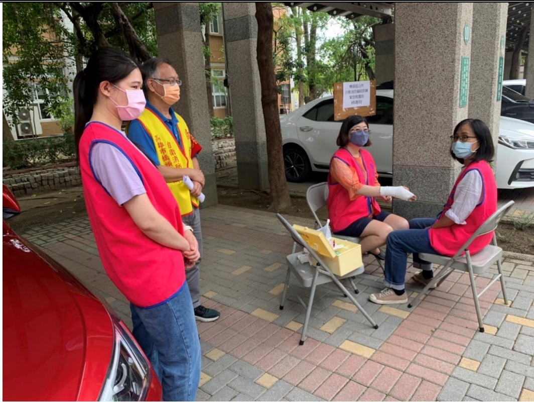
說明：救護急救處置情形 2