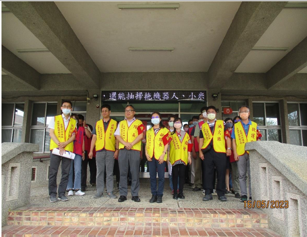
說明：災後清點人數