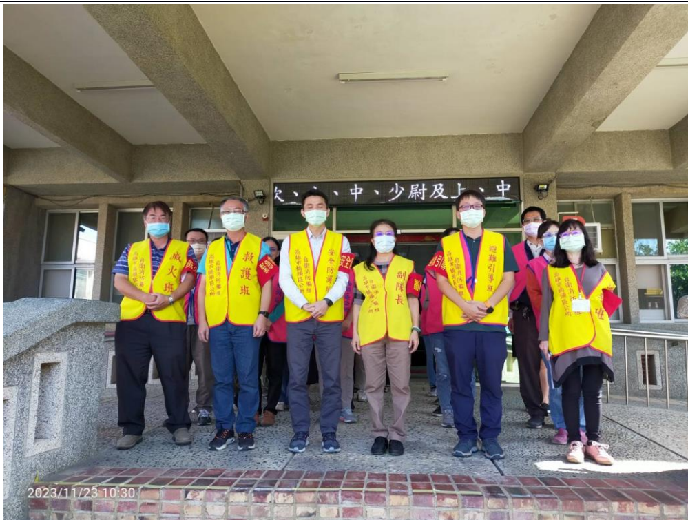
說明：災後清點人數