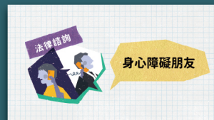
身心障礙者法律扶助專案