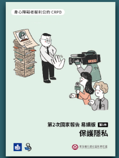
CRPD第2次國家報告 易讀版(1套共4本)