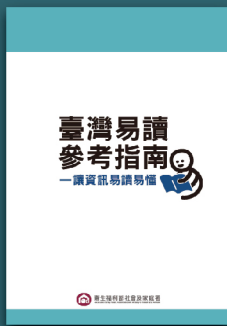
臺灣易讀參考指南 一讓資訊易讀易懂