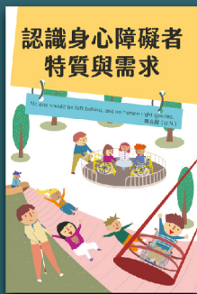
認識身心障礙者 特質與需求