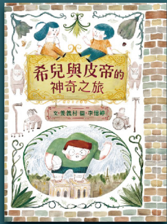
希兒與皮帝的神奇之旅 臺灣手語繪本