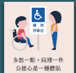
不占用身心障礙者 專用停車位