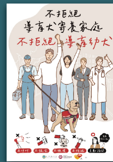
不拒絕導盲犬寄養家庭 不拒絕導盲幼犬