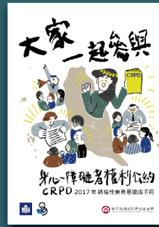
2017年CRPD 結論性意見易讀版手冊