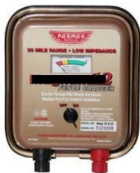
圖二：(直流電)電牧器(供電電源：DC12V 或 12 電池；最大能量傳輸距離 20 公里；輸出電壓：11KV；脈衝週期時脈衝電流：110mA 或 180mA；使用注意事項：(1)須安裝接地線(避免雷擊損毀)；(2)接電時應做好導線絕緣措施；(3)使用電壓檢測器量測電瓶電壓；(4)不可直接置於戶外任風吹雨淋；(5)農地較不適合使用太陽能型電牧器；(6)要經常巡查有無異物在電牧導線上避免漏電。)