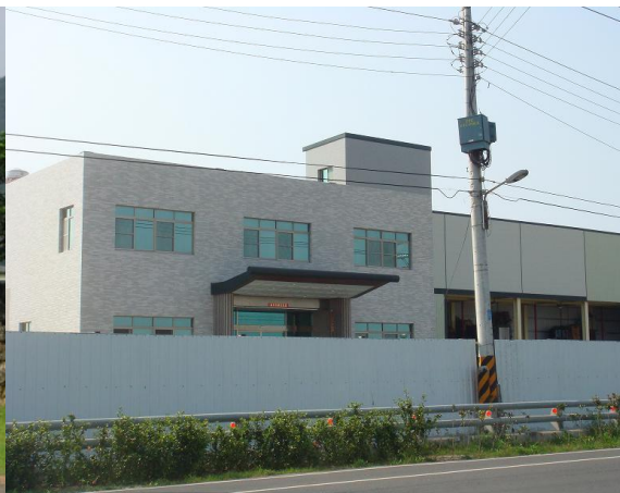
違規樣態：農地違規搭建工廠