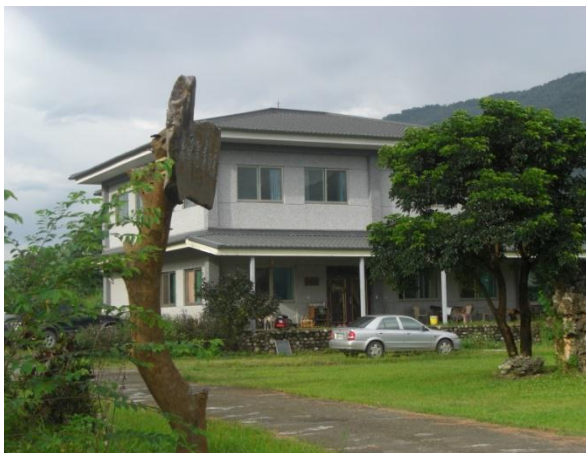
違規樣態：農地違規興建住宅

非都市土地違規大致區分態樣為違規建築使用、違規供工業使用、違規堆置土石或廢棄物、擅自開挖整地等樣態，非經許可擅自使用均屬違規行為。