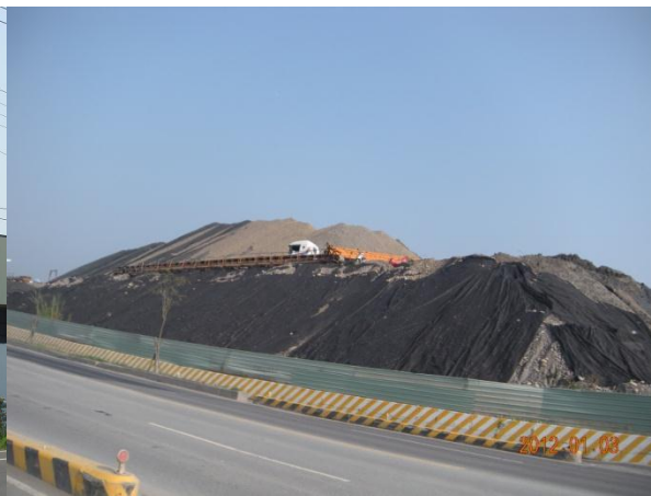
違規樣態：農地違規堆置土石