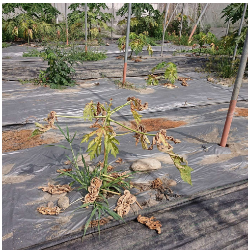
葉蟎密度高影響植株生長勢