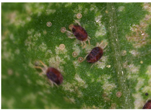
農民俗稱的紅蜘蛛