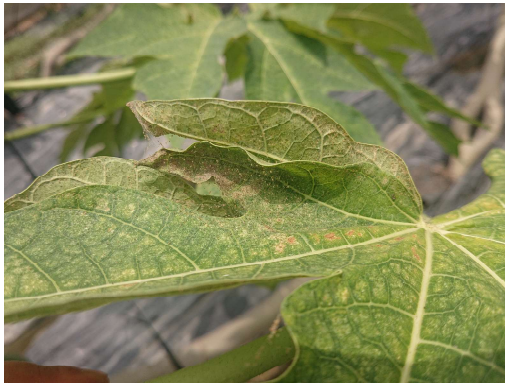
葉蟎密度高時會結網以利風吹散播