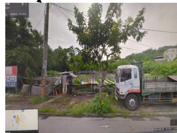
1.中正路 683 號旁 2.此處菜園易儲水，故不定期巡視