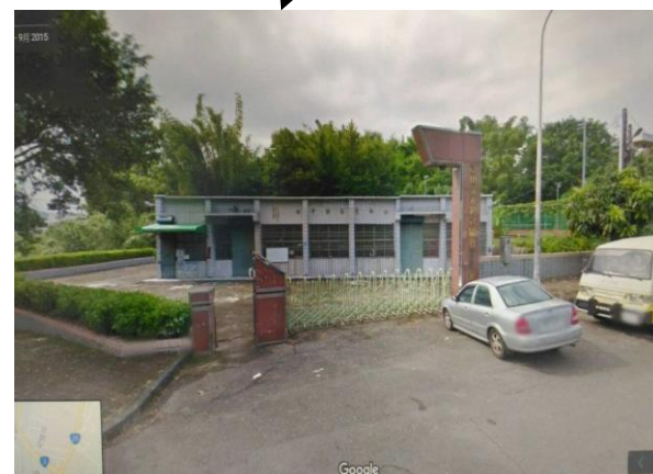
1.旗文路 125-5 號(永和社區活動中心) 2.地處偏遠，晚上人煙稀少