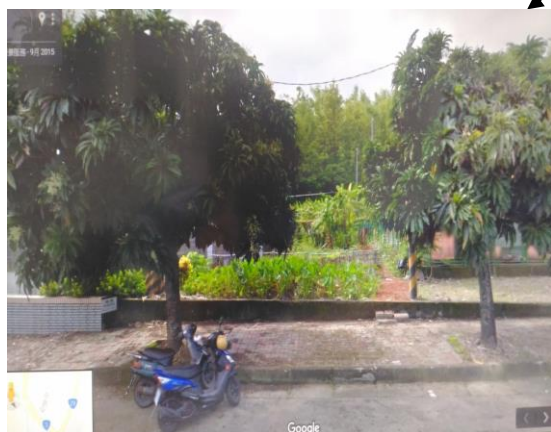
1.旗文路 125-5 號旁 2.此菜園鄰近活動中心，故加強巡視 3.人員往來頻繁