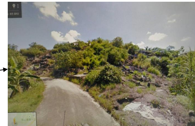
1.旗山六張犁第一公墓 2.地處偏遠，人煙稀少