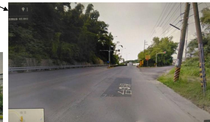
1.台三省道與旗文路 254 號旁交口 2.道路入口視線狹窄不清，易被草木阻擋