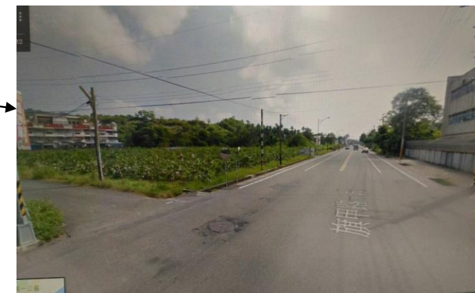
1.旗甲路一段 353 巷入口前 2.位處台 3 省道車輛往來頻繁，省道兩側，側溝大半未加蓋或無護欄，且與巷道交口均尚未加裝三色號誌控管，里民進出危險。