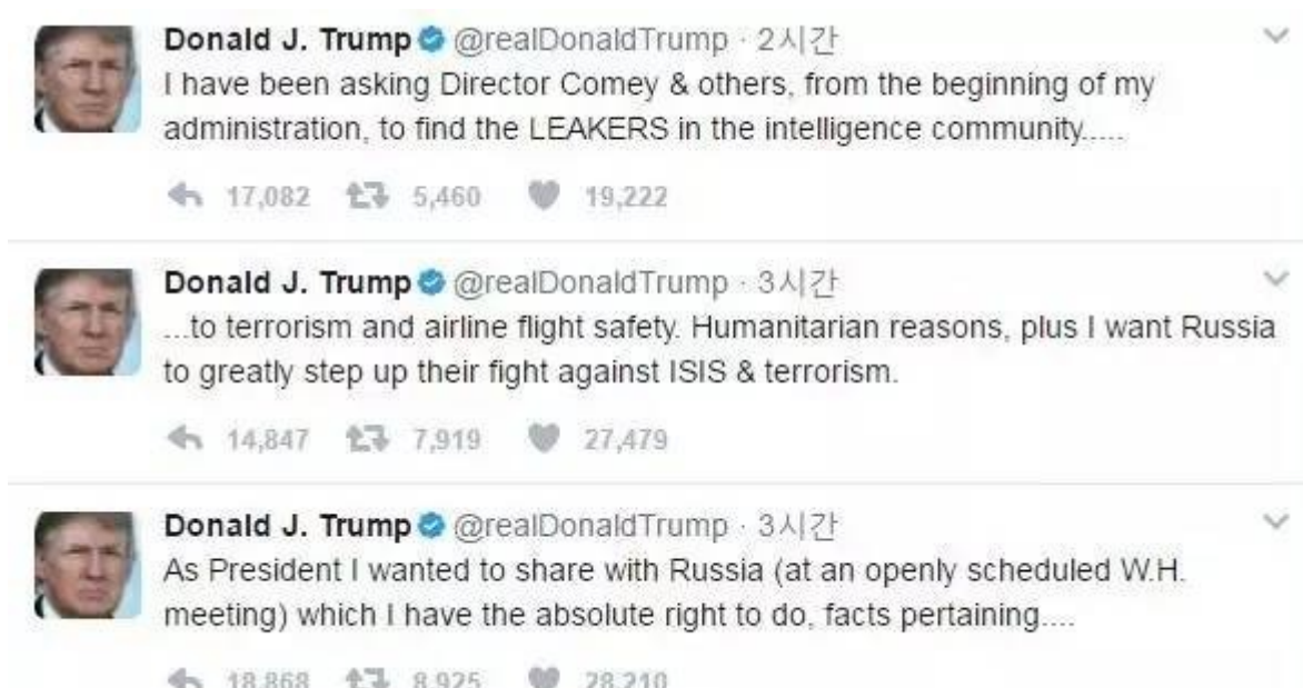
川普推特截圖