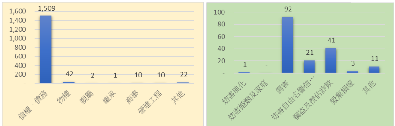
表1 高雄市三民區近5年調解案件概況—按民事、刑事類別分