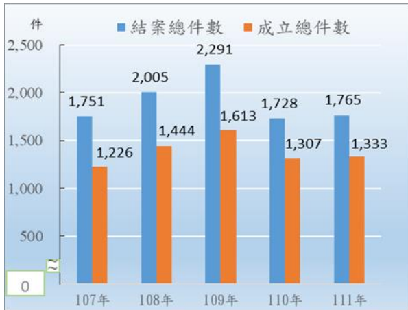
圖1 高雄市三民區近5年調解案件概況—按結案、成立總件數分