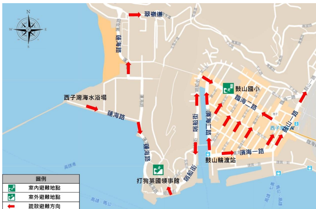
圖 1 西子灣海水浴場至鼓山一路避難路線圖