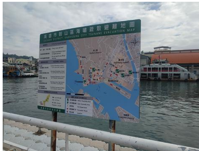
圖 11 鼓山區哨船頭公園前告示牌設置實景圖