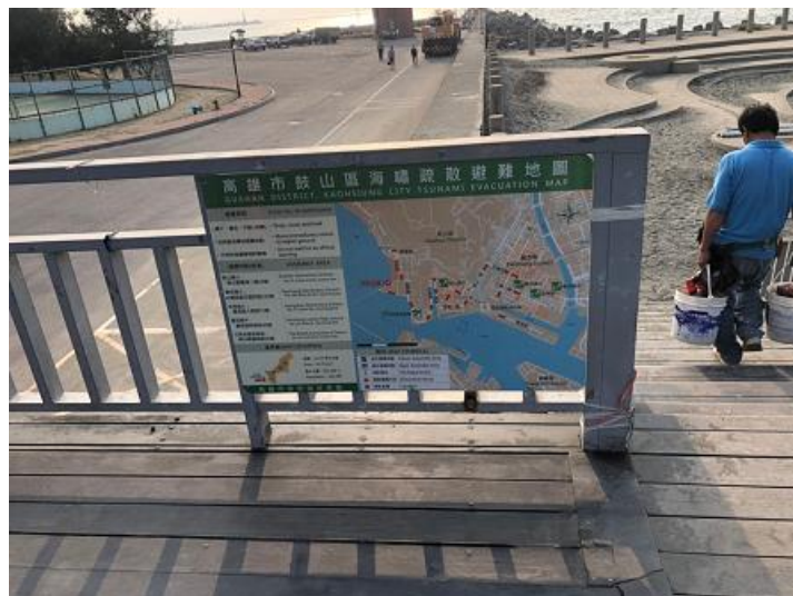
圖 7 鼓山區西子灣海水浴場告示牌設置實景圖