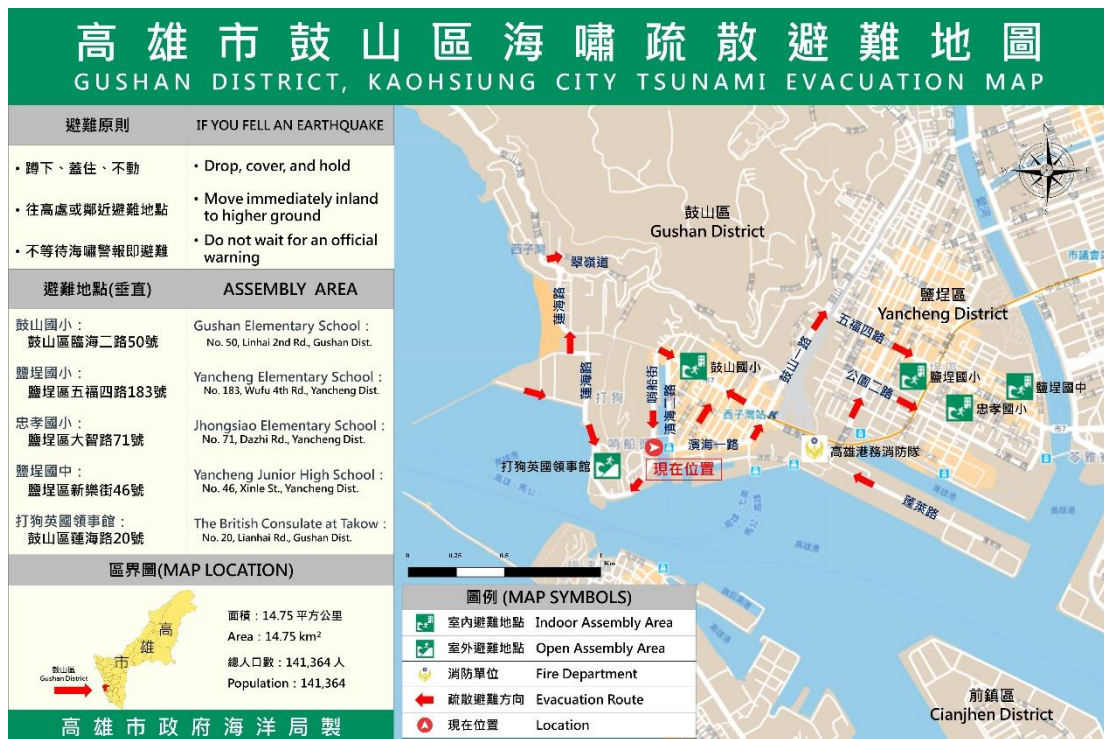
圖 4 位於鼓山區哨船頭公園前之海嘯疏散避難地圖