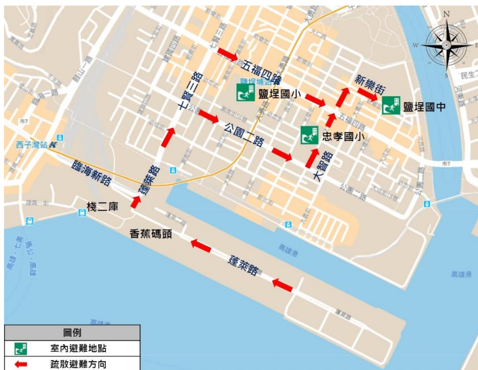
圖 2 臨海新路至蓬萊路避難路線圖

福四路直行，經大智路左轉後直行，再經新樂街右轉，便可抵達鹽埕國中避難地點，進入避難地點後，冷靜聽從指示人員引導往高樓層移動後，靜候解除警報。