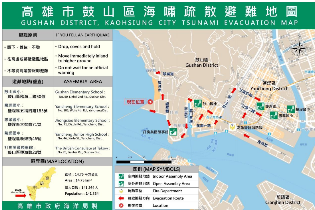
圖 3 位於鼓山區西子灣海水浴場之海嘯疏散避難地圖