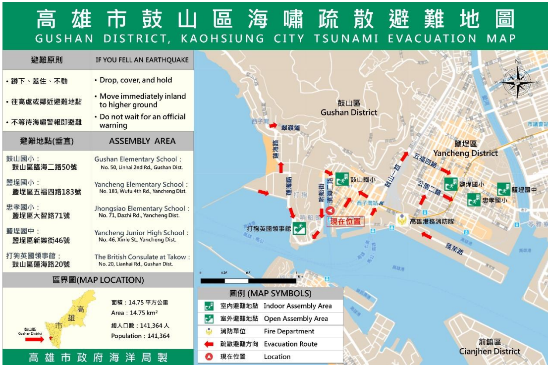
圖 5 位於鼓山區鼓山輪渡站之海嘯疏散避難地圖