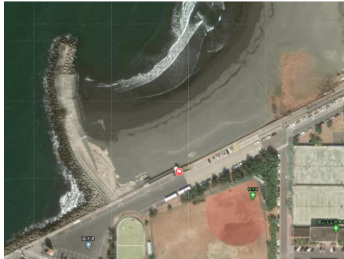
圖 6 鼓山區西子灣海水浴場空照圖

座標為 N 22.62357°、E 120.26244°，周圍空曠且前方無遮蔽物，指示牌可醒目設置、不影響民眾動線，為觀光景點且人潮聚集處，故納入選址地點，西子灣海水浴場之空照圖如圖 6 及實景圖如圖 7 所示。