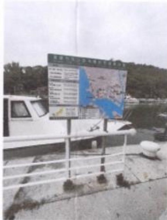
圖 9 鼓山區鼓山輪渡站告示牌設置實景圖