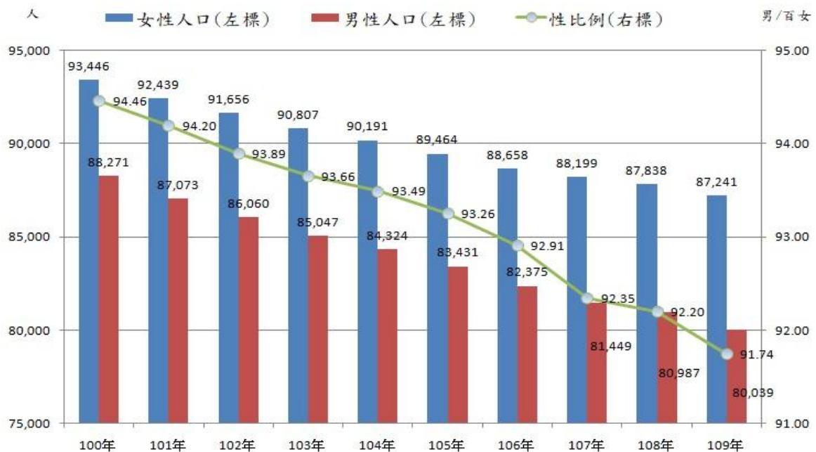
圖 1 100~109 年底高雄市人口性別概況

109 年底本區人口總計 16 萬 7,280 人，其中男性為 8 萬 0,039 人(占 47.85%)，女性為 8 萬 7,241 人(占 52.15%)，女性人口略多於男性，分別較 108 年底減少 948 人(-1.17%)及減少 597 人(-0.68%)。109 年底本區人口性比例為 91.74，相當於 100 名女性對應 91.74 名男性，自 100 年底起性比例呈逐年降低趨勢，由 100 年之 94.46 降至 109 年之 91.74，每年度性比例皆低於 100，女性人口皆超過男性。(詳圖 1)