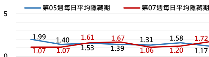
高雄市登革熱通報隱藏期統計資訊