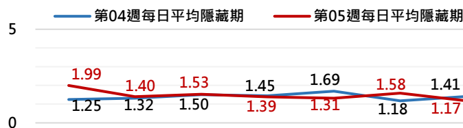
高雄市登革熱通報隱藏期統計資訊