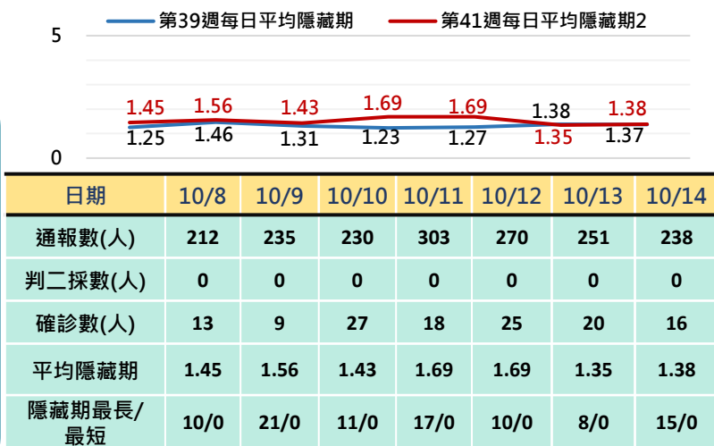
高雄市登革熱通報隱藏期統計資訊

從登革熱通報個案資料得知上週隱藏期平均為1.32天、本(41)週隱藏期平均為1.51天，以隱藏期週平均值做為比較基準，兩週相比，本(41)週比上週略為上升，詳如右圖所示。