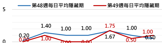
高雄市登革熱通報隱藏期統計資訊