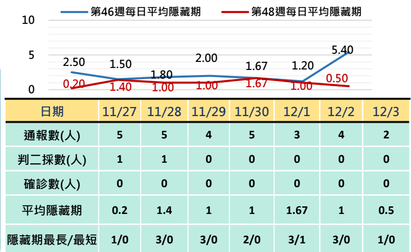
高雄市登革熱通報隱藏期統計資訊

從登革熱通報個案資料得知第上週隱藏期平均為2.3天、本（48）週隱藏期平均為0.97天，以隱藏期週平均值做為比較基準，兩週相比，本（48）週比上週略下降，詳如右圖所示。