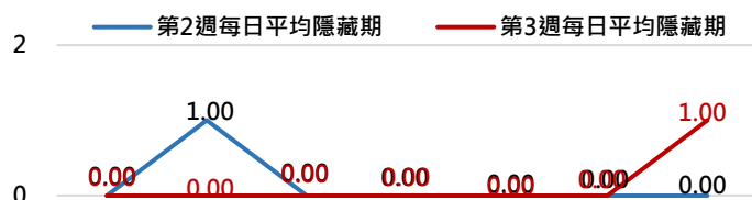
高雄市登革熱通報隱藏期統計資訊