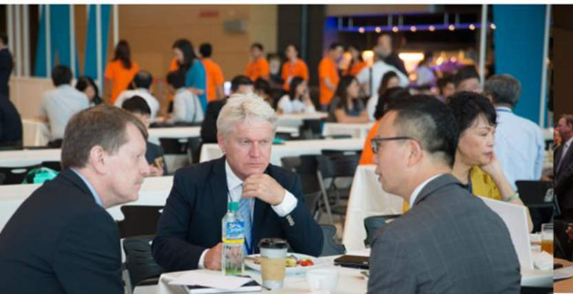
高雄最「會」· 世界一 「咖」交流茶會