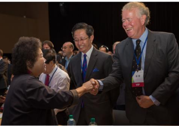
高雄市陳菊市長於開幕 典禮和與會外賓寒暄