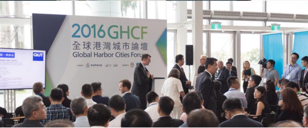
澳洲布里斯本市商洽交 流會