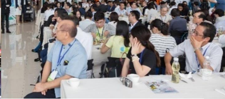
生態交通交流茶會