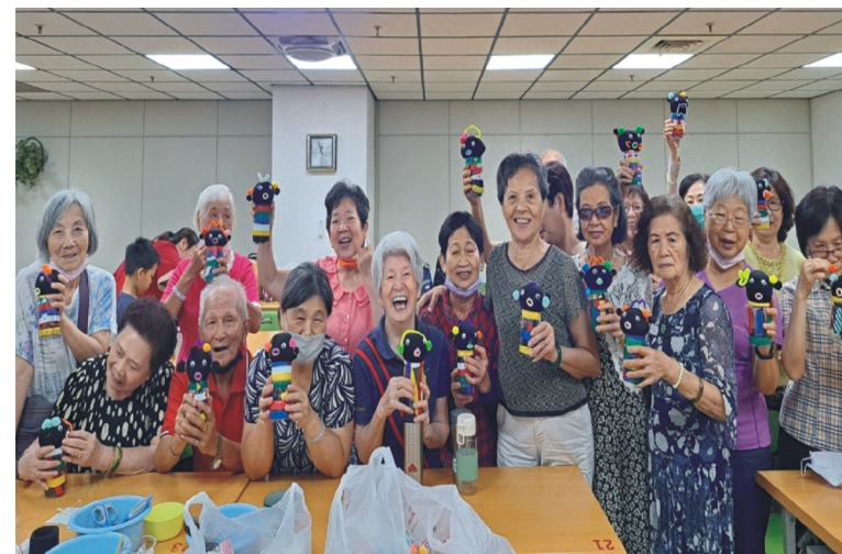
本中心日間託老服務「綠色植物療法」課程，長輩展示自己種植的小麥草盆栽