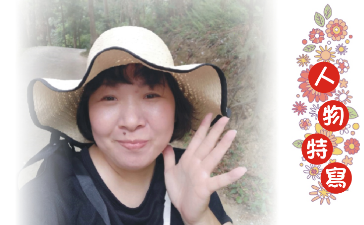
愛智家園社區據點的靈魂人物

除了據點課程，針對平日較少出門長者，亦可以採主動方式，提供社區老人關懷訪視、電話問安、諮詢及轉介等服務，透過各項服務的提供，讓社區的感覺如同家，更加緊密，社區照顧關懷據點歡迎您的加入!