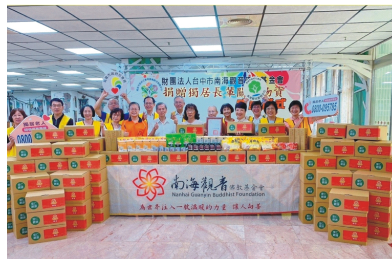
財團法人台中市南海觀音佛教基金會捐贈 素食中秋禮盒，嘉惠本市經濟弱勢獨居長者