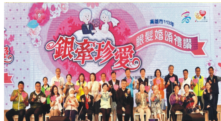
113年高雄市銀牽珍愛～銀髮婚頌禮讚 活動9月24日於漢來飯店巨蛋會館舉行，現場300對佳偶重溫幸福時光。