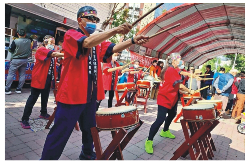
五甲老人活動中心在年節前夕舉辦熱鬧非凡的「馬舞迎春幸福到」社區聯歡活動，老幼共融迎新春！