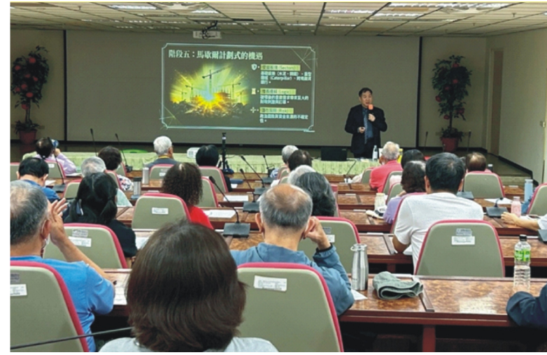
四維長青學苑4月通識講座邀請外商經理人，分享資產配置思維與風險管理觀念，協助長者建立正確理財認知。