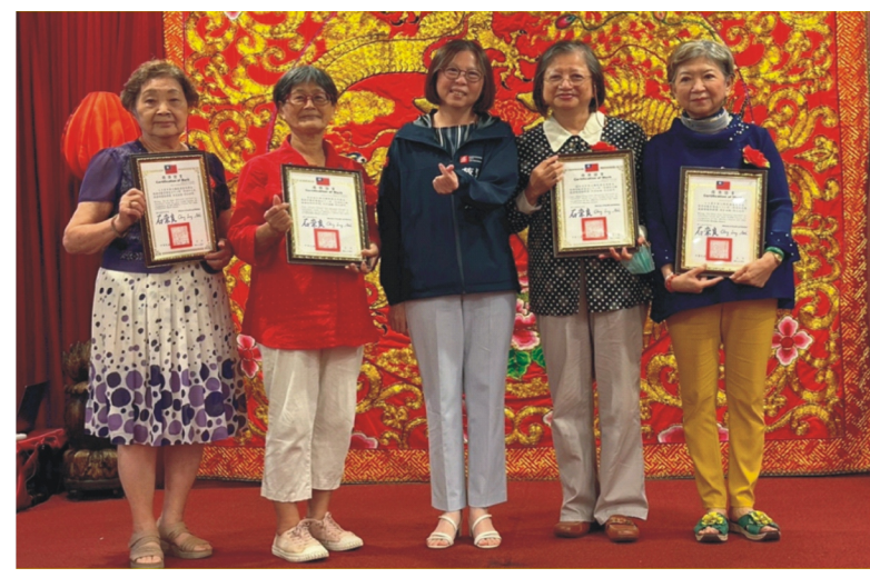
本中心辦理「志工授證表揚大會」，由社會局局長蔡宛芬頒發獎狀勳勵及感謝志工，並鼓勵更多高齡者一同投身志願服務行列。