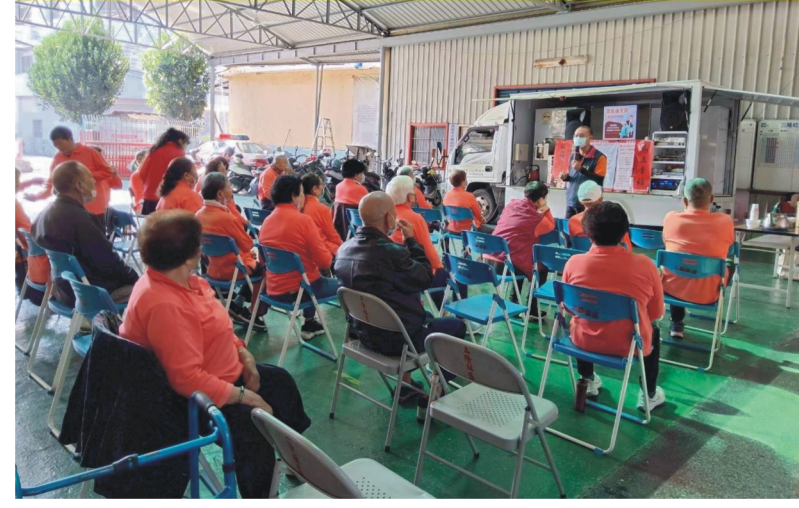
大寮區三隆社區-新春愉快