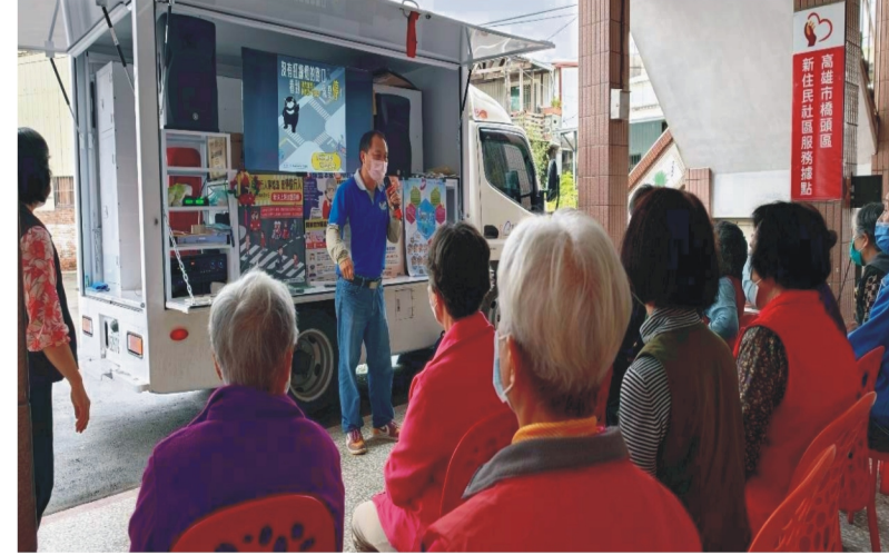
橋頭區筆秀社區-交安宣導