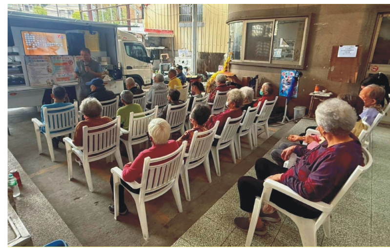
田寮區崇德社區-道安宣導