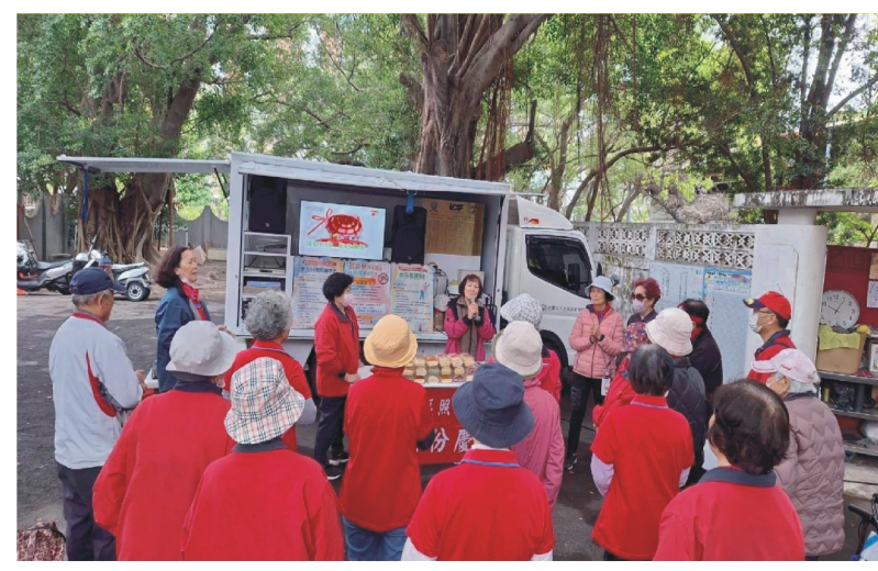
岡山區忠孝社區-慶生活動