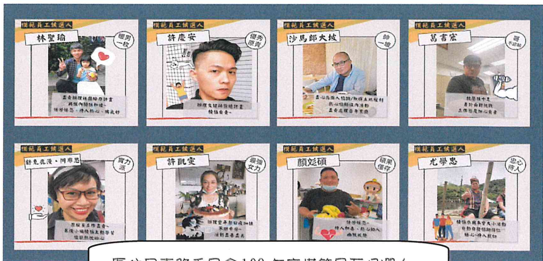
原住民事務委員會 109 年度模範員工候選人。

本會「模範員工英雄榜」活動分為二階段進行，第一階段請同仁無記名進行線上推薦，4 天便收到 35 則推薦信息，還有業務單位發起組內初選，試圖集全組之力讓組內推薦的候選人能順利雀屏中選，顯見同仁對活動相當感興趣!而第二階段則是為第一階段受推薦的 8 位模範員工候選人辦理線上投票作業，以每人 1 票的方式進行無記名投票，為提升同仁的參與感，特別蒐羅 8 位候選人的帥(美)照，並製成個人專屬的宣傳海報張貼於本會玄關處，吸引同仁目光，並藉由各候選人的優良工作事蹟，觸發同仁內心的感動。