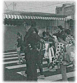
護童勤務：為強化學童上、下學行的安全，避免有心人士誘拐。

此外，轄区的特性，亦會影響警察的勤務規劃，以我任職的鼓山分局為例，轄區橫跨鼓山區、旗津區，設置6個派出(分駐)所，轄區內有農十六、美術館、小巨蛋等繁華、熱鬧的區域，亦有動物園、西子灣、旗津等著名的觀光景點，每遇農曆春節、端午節等重要節日或連續假日，大量觀光客湧進，就有賴妥善的交通疏導，才能維持交通的順暢。