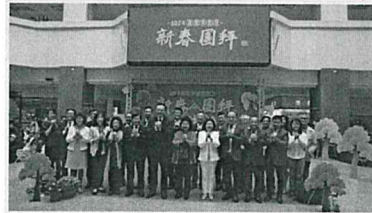
陳市長蒞率領一級機關首長及各區區長向市府同仁拜年

開春第1天上班日，本府分別假四維及鳳山行政中心舉辦新春團拜活動，由市長率領一級機關首長及各區區長向市府同仁拜年，大家互道新年恭喜，活動熱絡，喜氣洋洋。