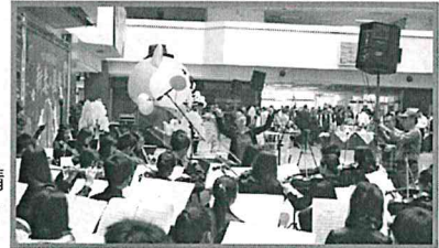
本市新興高中國中部青少年交響樂團學生帶來精采且的管弦樂演奏

活動開場首先由本市新興高中國中部青少年交響樂團學生帶來精采的管弦樂演奏，慷慨激昂的音樂，振奮人心，讓市府同仁們享受了一場心靈饗宴，接著本市樹德家商和三信家商分別帶來充滿熱情活力的「啦啦舞」及「台灣新世紀」原住民舞蹈表演，同學們高難度的演出，現場讚聲連連，活動現場並有六龜等20個區公所提供在地特色農產品及水果，整個會場熱鬧滾滾，春意盎然。