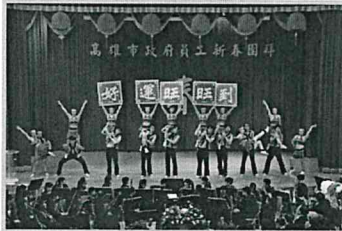
本市三信家商帶來充滿熱情活力的「台灣新世紀」原住民舞蹈表演

活動開場首先由本市新興高中國中部青少年交響樂團學生帶來精采的管弦樂演奏，慷慨激昂的音樂，振奮人心，讓市府同仁們享受了一場心靈饗宴，接著本市樹德家商和三信家商分別帶來充滿熱情活力的「啦啦舞」及「台灣新世紀」原住民舞蹈表演，同學們高難度的演出，現場讚聲連連，活動現場並有六龜等20個區公所提供在地特色農產品及水果，整個會場熱鬧滾滾，春意盎然。