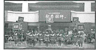
本市樹德家商暨信義家商新春的「啦啦舞」表演

開春第1天上班日，本府分別假四維及鳳山行政中心舉辦新春團拜活動，由市長率領一級機關首長及各區區長向市府同仁拜年，大家互道新年恭喜，活動熱絡，喜氣洋洋。