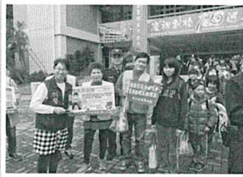
校園交通及防詐宣導：提升學童反毒、反詐騙預防犯罪常識

另由於分局轄區內動物園、西子灣、旗津等著名的觀光景點，外國觀光客遇到困難，波麗士也樂於給予協助，扮演友善的觀光大使。