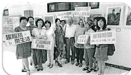
本市公教退休人員協會人員於藝文走廊參展畫作同框，展現樂齡生活

隨著世代潮流，志工角色也與以往有所差別，不再只是付出勞力和時間，而是能運用興趣、專長從事服務，這次畫展即是一個成功的例子，也希望藉由此次經驗吸引更多公教員工將志願服務納入生涯規劃中，自助助人，也為生活注入更多正面能量。