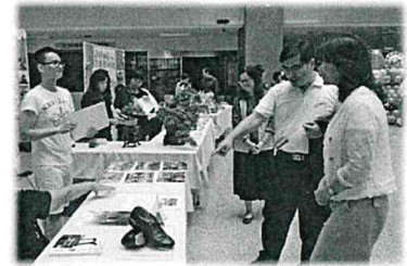
蔡副秘書長柏英蒞臨社團成果展活動，葉處長瑞與陪同至各社團攤位參觀解說

社團成果展充分展現了本府員工的多才多藝與熱情活力，吸引民眾駐足欣賞；運動舞蹈社、踢踏舞蹈社、太極拳社、英語演講社、心光社等動態社團精采演出更將活動氣氛沸騰至最高點，本府蔡副秘書長柏英特別親自蒞臨表示對本次活動的肯定與支持。