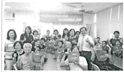
楠梓區公所「歡喜作伙來呷飯」老人共餐活動，將資源用於在地弱勢老人，落實在地老化！

對於社會救助政策完善之落實，自許只要在該崗位上的一日，仍抱著苦民所苦及推己及人的態度為民服務。除了是責任亦為榮譽，替眾人謀福利，並能力行不懈，樂之不疲，自我因此而豐盈，人生也因此而價值連城。