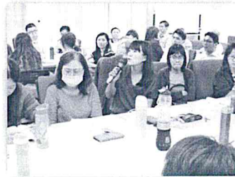
本處業務承辦同仁就杜鵑颱風 停班課策進行經驗分享

親愛的讀者您好，如您對本刊有任何建議、或洽詢投稿事宜，歡迎來信至讀者信箱，高雄市政府人事處電子報感謝您的支持與指教！