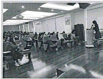
宣導進用身心障礙人員及原住民業務

為期本府各機關人員共同維護身心障礙者工作權益，並避免因未足額進用前揭人員而受罰，本科於106年3月10日下午假公務人力發展中心三樓多媒體教室舉行進用身心障礙人員及原住民業務宣導活動，宣導對象包含本府一、二級機關、學校、區公所人事人員，共計100名。