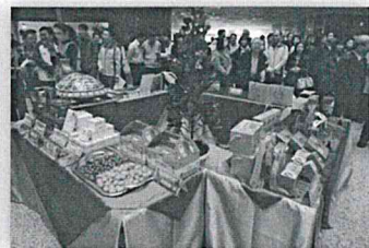
市府團隊齊聚一堂場面溫馨、愉快 祈福活動陳列各區名產彰顯在地特色