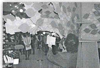
市長為市府廣場祈願樹繫上新願卡

9天新春假期結束，高雄市政府將原訂於上班第一天舉行之新春團拜活動，改為新春祈福會，為台灣集氣加油，凝聚正面的力量。