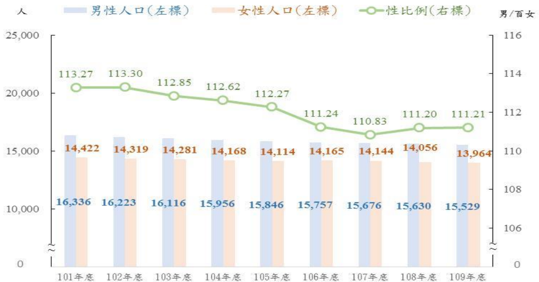
圖 1 101~109 年底高雄市燕巢區人口性別概況

109 年底本區人口總計 2 萬 9,493 人，其中男性為 1 萬 5,529 人(占 52.65%)，女性為 1 萬 3,964 人(占 47.35%)，男性人口略多於女性，分別較 108 年底減少 101 人(-0.65%)及減少 92 人(-0.65%)。109 年底本區人口性比例為 111.21，相當於 100 名女性對應 111.21 名男性，自 101 年底起性比例呈逐年降低趨勢，由 101 年之 113.27 降至 107 年之 110.83，108 年底起性比例再度提升，至 109 年底為 111.21。(詳圖 1)